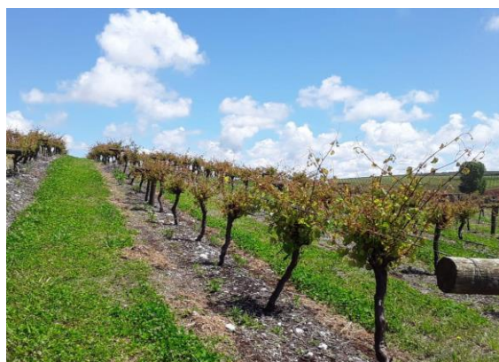
Figura 4: Matriseiro do porta-enxerto cultivar Paulsen 1103.

O uso de porta-enxertos é uma técnica usual ainda nos dias atuais para a maioria das espécies frutíferas temperadas exploradas economicamente, a utilização desse método está atrelada a uma série de benefícios oferecidos pelos porta-enxertos como: controla do vigor das plantas, rápida entrada em frutificação e melhoria de atributos relacionados quantidade e qualidade dos frutos produzidos (FARIAS, 2011).