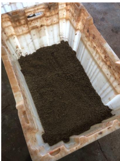
Figura 10: Leve camada de vermiculita umedecida. cera fúngica

Após resfriada as estacas as mesmas serão postas em caixas plásticas todas de pé com a gema para cima, contendo dentro da caixa uma leve camada de vermiculita umedecida, com o intuito de não ter perda de água, suprimindo a necessidade das mudas para o desenvolvimento do calo.