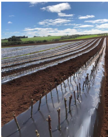
Figura 15: Plantio de mudas de videira.

cautela devido se um plástico ficar grudado na base da muda impedirá o seu desenvolvimento radicular, ocorrendo o mal desenvolvimento ou até mesmo a morte da muda.