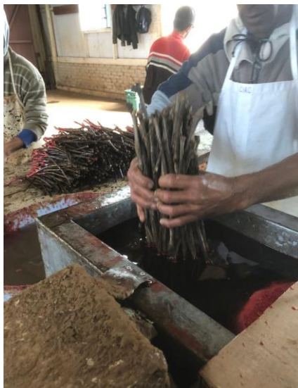
Figura 9: Momento do mergulho em cera aquecida, para a proteção do enxerto.

Após resfriada as estacas as mesmas serão postas em caixas plásticas todas de pé com a gema para cima, contendo dentro da caixa uma leve camada de vermiculita umedecida, com o intuito de não ter perda de água, suprimindo a necessidade das mudas para o desenvolvimento do calo.