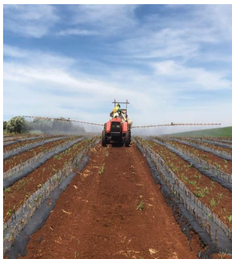
Figura 17: Aplicação dos tratamentos.

Utilização de alguns defensivos agrícolas como: Dithane® NT, Karate Zeon 250 CS, Totalit®, Zetanil® e Forum®.