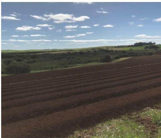
Figura 1: Solo preparado com encanteiradeira.