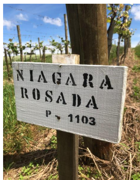
Figura 6: Matrizeiro de Niágara Rosada

Uma prática utilizada era desinfecção das tesouras com iodo e álcool 70%, impedindo a contaminação entre plantas durante e após a poda.