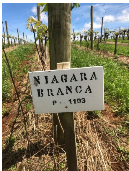
Figura 5: Matrizeiro de Niágara Branca

Por isso, é indispensável adquirir material propagativo de excelente qualidade (estaca do porta-enxerto e gema da produtora) de viveiristas credenciados e regularmente fiscalizado pela Secretaria Estadual de Agricultura. Da mesma forma, deve-se verificar a identidade do porta-enxerto e da cultivar enxertada e a sanidade das mudas, particularmente com relação às viroses que se torna algo muito importante na produção de mudas. Caso não se obtenha estes cuidados poderá estar comprometendo a viabilidade econômica do empreendimento, pela introdução de focos de doenças e pragas de difícil controle e crucificando pomares (EMBRAPA, 2003).