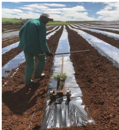
Figura 3: Perfuração manual da lona plástica: Uso de suporte de ferros com pinos colocados de acordo com espaçamento do plantio nas duas filas do canteiro.