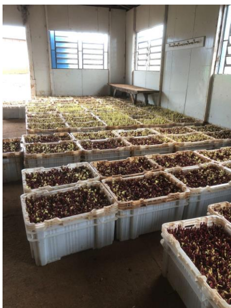
Figura 14: Período de aclimação.

Na etapa que se segue após a forçagem dos enxertos, as mudas passam por uma etapa chamada de aclimação, durante aproximadamente uma semana, visa reduzir possíveis estresses que são provocados pelo excesso luminosidade causado pela troca de ambiente e de variações de temperatura e umidade. As caixas de mudas serão, então, transferidas para galpões abertos, onde a exposição à luz deve ser feita de forma gradual. E após alguns dias de adaptação no ambiente, as mudas são transplantadas no campo em viveiros em céu aberto, onde permanecem por praticamente um ano, para formação do sistema radicular e seu total desenvolvimento (REGINA et al., 1998).