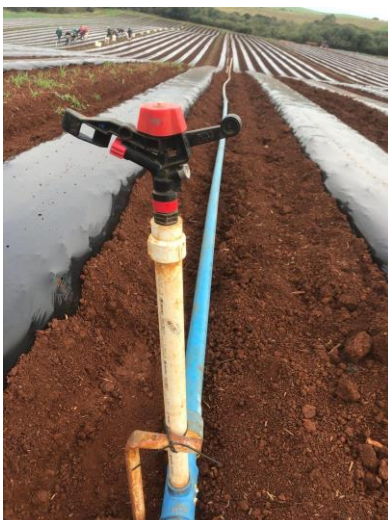
Figura 16: Sistema de aspersão.