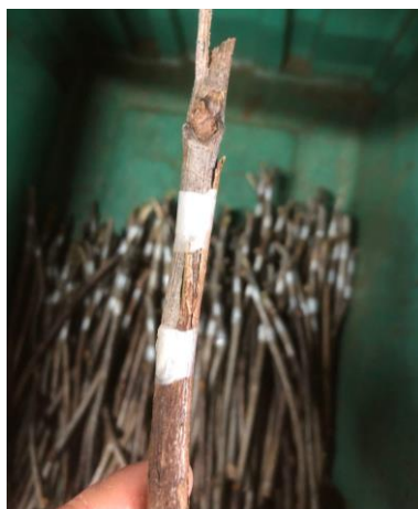
Figura 8: Extremidades do enxerto amarradas.

Este método é feito manualmente, apesar de ser mais demorado que um por máquinas como (tipo ômega), será mais viável devido ao seu alto índice de pega. Ao serem efetuadas as enxertias ela deverá ser amarrada nas duas pontas do corte para evitar assim a abertura ou a danificação do enxerto, após isso são mergulhadas em cera aquecida para a proteção da região da união do enxerto, em temperatura de 70 a 80 C° e imediatamente resfriados em água. A cera utilizada é utilizada especialmente para o processo de enxertia, contendo fungicida e fitorreguladores em sua composição, tendo como objetivo proteger a zona de união da enxertia contra o dessecamento dos tecidos e a penetração de agentes patogênicos.