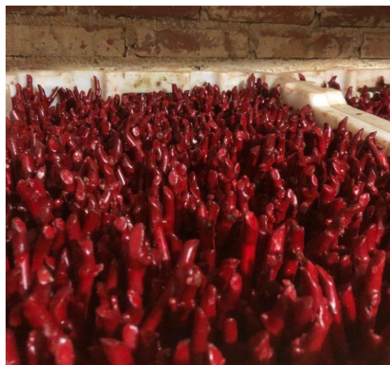
Figura 11: Enxertos finalizados com

Ocorre a identificação de caixa com o nome da cultivar enxertada e porta enxerto utilizado e a data da efetuação da enxertia, após são levadas até a câmara de forçagem para o recebimento de uma elevada taxa de calor por alguns dias, onde haverá a diferenciação celular, cicatrização na união das duas partes de material vegetal para a formação de uma nova planta.