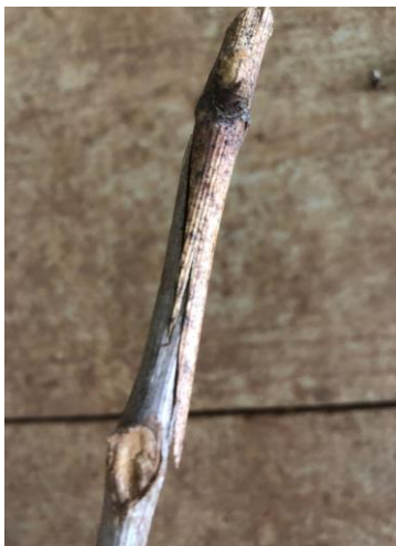
Figura 7: Enxerto efetuado (inglês complicado).

Este método é feito manualmente, apesar de ser mais demorado que um por máquinas como (tipo ômega), será mais viável devido ao seu alto índice de pega. Ao serem efetuadas as enxertias ela deverá ser amarrada nas duas pontas do corte para evitar assim a abertura ou a danificação do enxerto, após isso são mergulhadas em cera aquecida para a proteção da região da união do enxerto, em temperatura de 70 a 80 C° e imediatamente resfriados em água. A cera utilizada é utilizada especialmente para o processo de enxertia, contendo fungicida e fitorreguladores em sua composição, tendo como objetivo proteger a zona de união da enxertia contra o dessecamento dos tecidos e a penetração de agentes patogênicos.