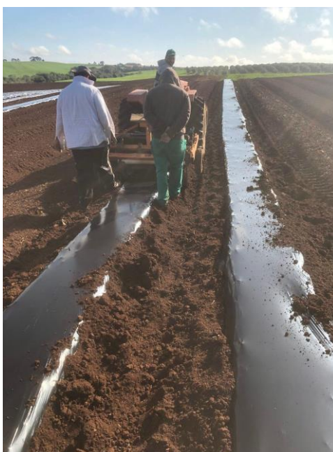
Figura 2: Máquina acoplada ao trator que estende, tapa as bordas em uma única operação

Deve-se ter no máximo 75 cm de largura, e ser distanciados de, pelo menos, 50 centímetros de um canteiro a outro. Em seguida, são perfurados estes canteiros com um rolo de pontas com as distâncias desejáveis de cultivo sempre respeitando a densidade de plantio. Normalmente, são empregadas duas fileiras de mudas distanciadas de 25 a 30 centímetros. Em cada fileira, são plantadas 20 a 25 plantas por metro linear, totalizando de 40 a 50 plantas por metro de canteiro.