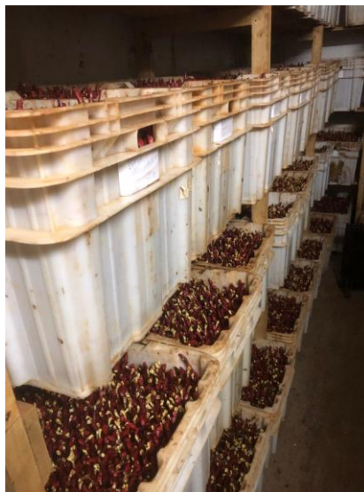
Figura 12: Enxertos na câmara de forçagem.

No interior da câmara de forçagem a temperatura média é de 28 a 30 C° e a umidade relativa do ar em média de 90 a 95%, essas caixas são cobertas com um plástico preto, para que os enxertos não recebam a luminosidade e desenvolvam o mínimo possível de brotação para evitar a perda de suas reservas. Estas caixas permanecem na câmara de forçagem por um período de 12 a 15 dias dependendo da exigência de formação do calo de cada cultivar enxertada.