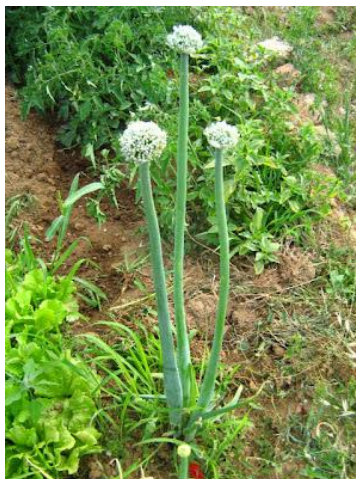
Figura 3 - Cebola com bolting-Boa Vista do Sul

beneficiamento, há uma forte pressão de queda no preço. Em hipótese alguma o produtor deseja que haja “bolting” no primeiro ano de plantio, pois é constatada a perda total de produção e prejuízo próximo aos 100% de capital investido.