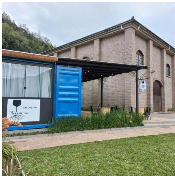
Figura 5 - Enocafeteria Terroir 29