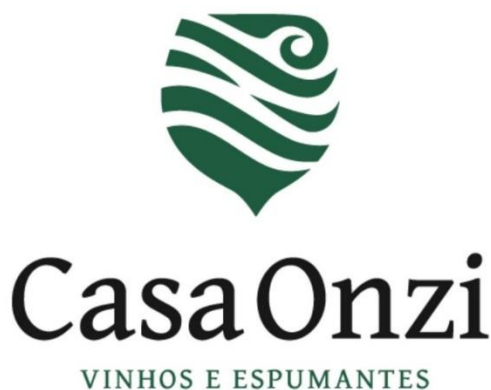
Figura 1 - Logo Casa Onzi

A marca Casa Onzi (Figura 1) foi lançada no mercado em 2004 pela quarta e atual geração da família Onzi, a qual veio para o Brasil em meados de 1875 e logo se estabeleceu em Caxias do Sul, Rio Grande do Sul. A primeira variedade plantada nas terras pertencentes à família foi a Isabel, que se trata de uma cultivar híbrida, natural das espécies Vitis vinifera e Vitis labrusca , de fácil adaptação.