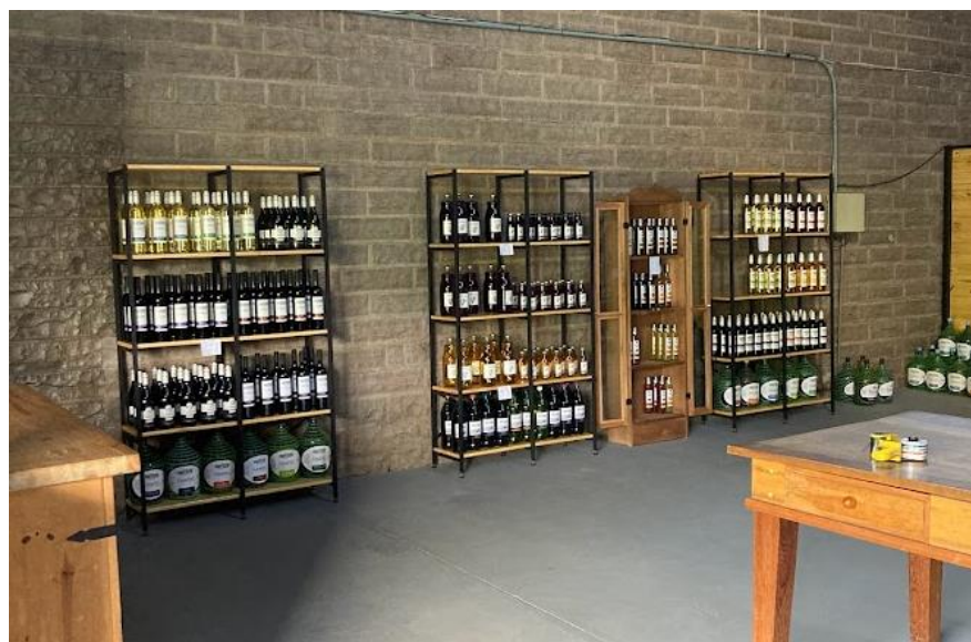
Figura 7 - Varejo

A Casa Onzi possui uma linha completa de produtos (Figura 7): vinhos finos, vinhos de mesa, espumantes e sucos. Porém, em todos os seus hectares o plantio é somente de uva Bordô – cultivar americana, da espécie Vitis labrusca . As demais variedades utilizadas na produção do catálogo são compradas de produtores vitícolas da região, os quais já são parceiros da vinícola.