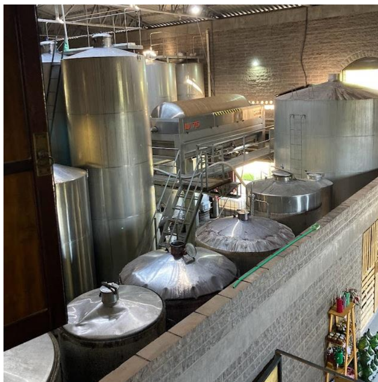
Figura 3 - Espaço interno vinícola