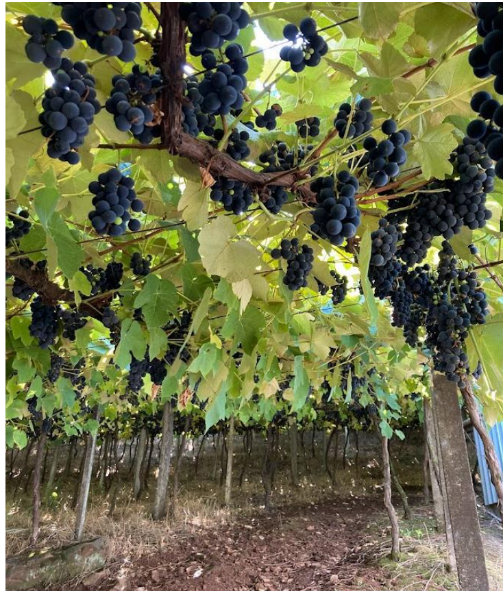
Figura 4 - Vinhedos