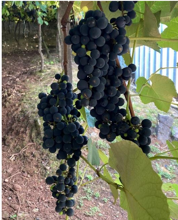
Figura 8 - Uva Bordô