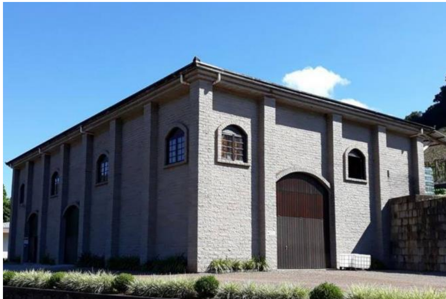
Figura 2 - Vinícola

produção, 5,5 hectares de uvas plantadas (Figura 4) e uma cafeteria (Figura 5 e 6), aberta recentemente como atrativo para difundir o turismo enológico.