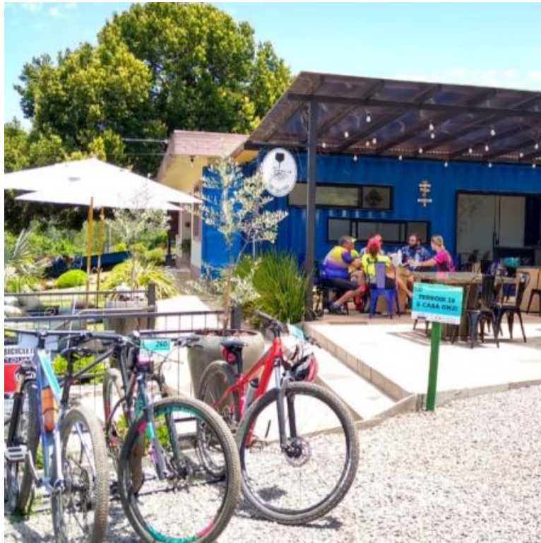
Figura 6 - Enocafeteria aberta ao público