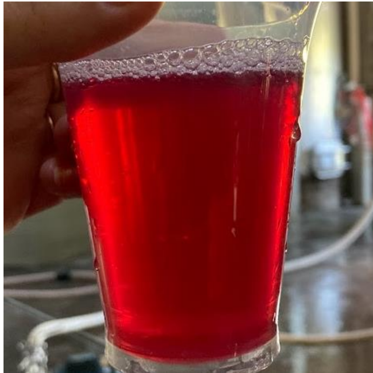
Figura 10 - Coloração da primeira extração de mosto