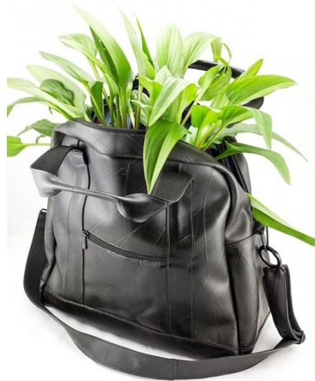
Figura 3 - Produto final Vuelo

Disponível em: https://www.dpaschoal.com.br/C%C3%93mara-de-ar-para-caminh%C3%A3o-MAXXICARGO-1000X20-131-132-/p/1600087