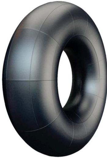
Figura 2 - Matéria prima utilizada pela Vuelo

Disponível em: https://www.dpaschoal.com.br/C%C3%93mara-de-ar-para-caminh%C3%A3o-MAXXICARGO-1000X20-131-132-/p/1600087