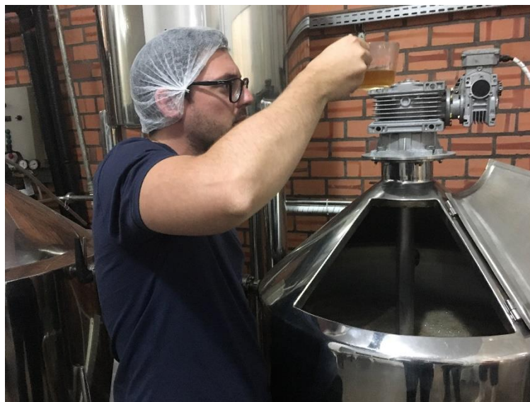
Figura 1 – Mostura e obtenção do mosto para fermentação.

Após, ocorre a fervura, onde o mosto é esterilizado e influencia diretamente na cor e no sabor da cerveja, por meio de reações de caramelização e reações entre proteínas e açúcares, denominada reação de Maillard.