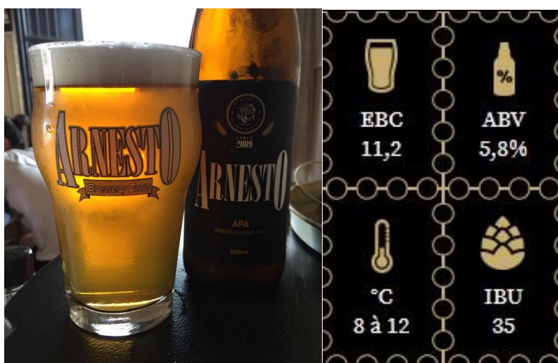
Figura 2 – Cerveja American Pale Ale (APA)

A figura 3 apresenta a American Pale Ale (APA) da empresa.