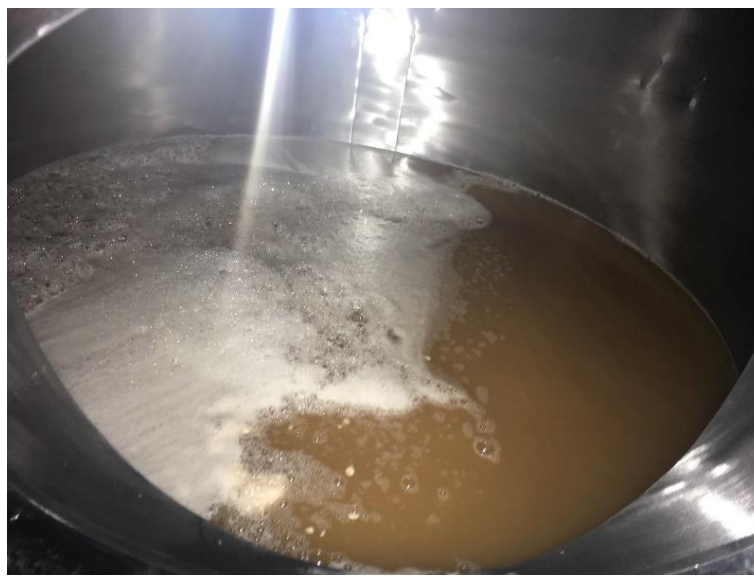
Figura 2 – Fervura do Mosto

duas fases distintas: A primeira para dar amargor a cerveja, e a segunda auxiliando em sua complexidade aromática.