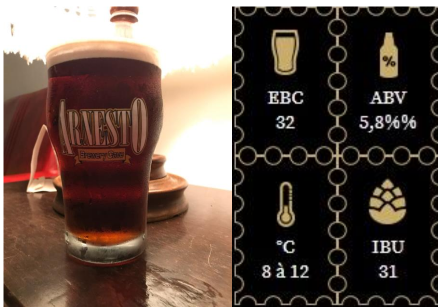
Figura 4 – Cerveja American Brown Ale

A figura 4 apresenta a American Brown Ale da empresa.