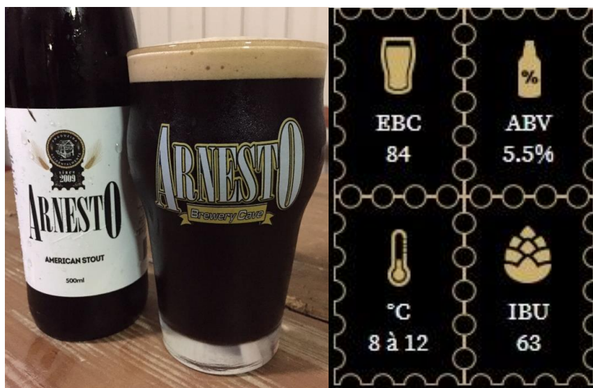
Figura 5 – Cerveja American Stout

A figura 5 nos mostra a cerveja American Stout da empresa.