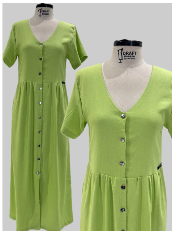
Figura 4- Vestido Modificado