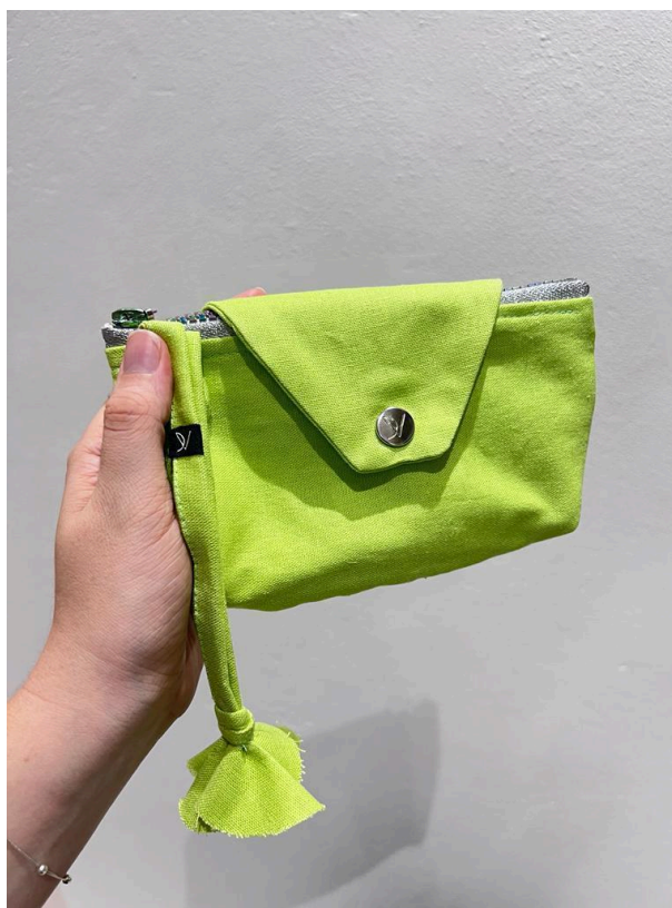
Figura 5- Necessaire Carol