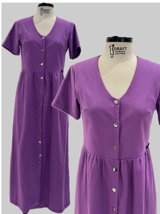
Figura 3- Vestido Original