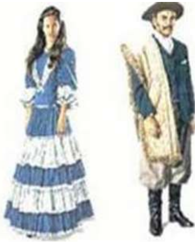
Figura 5 - Traje Pilcha Gaúcha (1865 aos dias de hoje)

tom, a parte das costas de tecido mais leve, chapéu, lenço no pescoço ou nos ombros, branco ou vermelho, bombacha em brim, linho ou algodão liso, listrado ou xadrez discreto em cores claras ou escuras sóbrias e neutras, faixa de lã preta ou vermelha, guaiaca, bota de couro e esporas. O traje feminino é composto por vestido inteiro ou cortado na cintura, corte princesa ou estilo cadeirão, decote pequeno, mangas longas ou até o cotovelo podendo ter babados nos punhos, comprimento da barra da saia até a barra do pé (Abreu; Cirne, 2003).