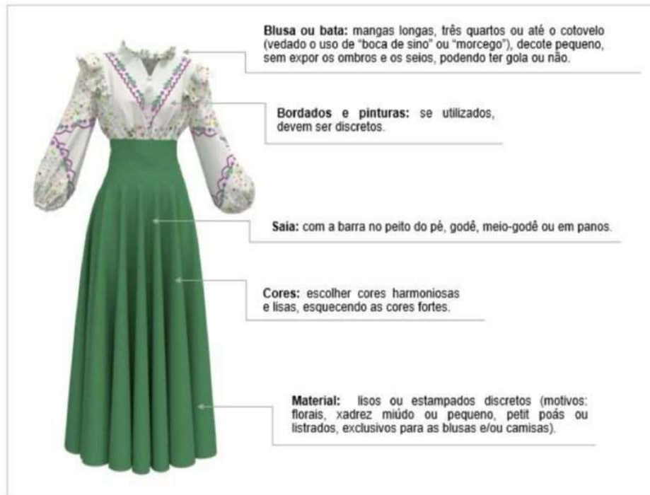
Figura 8 - Saia e Blusa Prenda Adulta