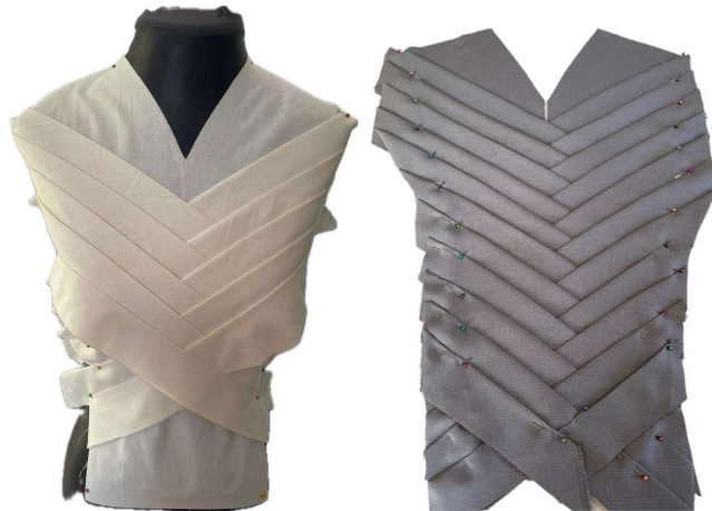
Figura 13 - Moulage das pregas do corpo

A modelagem da blusa foi cortada e costurada em algodão cru, para, posteriormente, modelar as pregas do corpo adotando técnicas de modelagem tridimensional (moulage), diretamente no manequim de costura. As pregas, cortadas no viés, com 10 cm de largura, foram dobradas ao meio e vincadas a ferro. A aplicação foi feita a partir da linha do ombro, de forma transversal, sobrepondo uma a uma em uma distância de 3cm, conforme é possível observar na Figura 13.