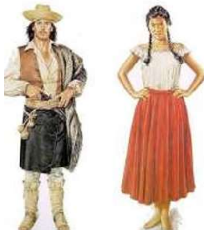
Figura 2 - Traje Peão das Vacarias e China das Vacarias (1730-1820)