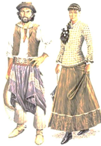
Figura 4 - Traje Chiripá Farroupilha (1820-1865)