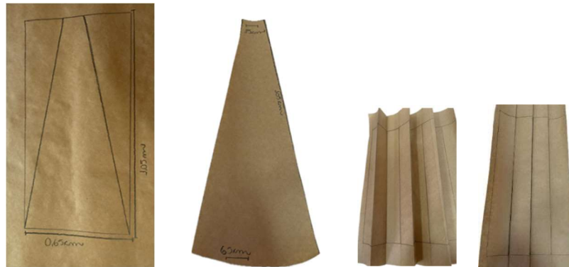
Figura 14 - Molde dos panos da saia e pregas do babado