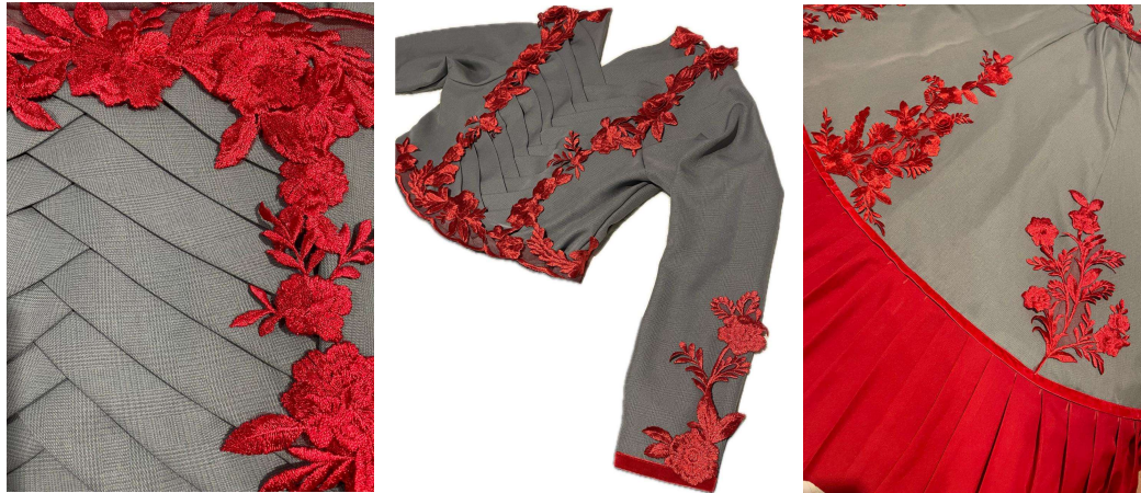
Figura 15 - Aplicação da renda e detalhes do modelo