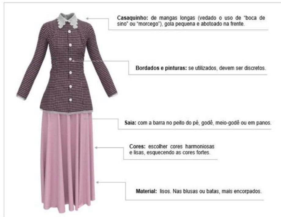
Figura 9 - Saia e Casaquinho da Prenda Adulta