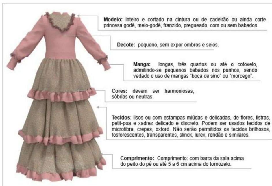
Figura 7 - Vestido da Prenda Juvenil

A Figura 7 representa um modelo de vestido de Prenda Juvenil, decote v com babado, mangas longas com punho e babado, cortado na cintura, saia com comprimento da barra acima do tornozelo com babados e acabamento de fita, em tons de rosa e marrom.