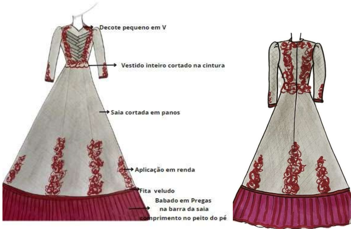
Figura 11 - Croqui do modelo do vestido de prenda

saia, além de fita de veludo tom cereja para acabamento dos babados e punho das mangas. A Figura 11 apresenta o croqui do modelo.