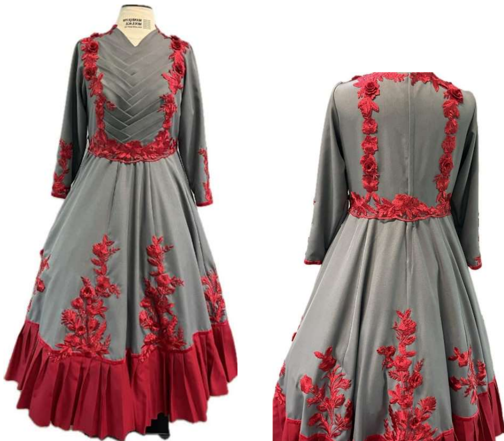
Figura 16 - Vestido da Prenda Adulto (frente e costas)

Por fim, blusa e saia foram unidas, resultando no modelo de vestido cortado na cintura. A Figura 16, apresenta o modelo de vestido da Prenda Adulta, frente e costas, proposto neste estudo.