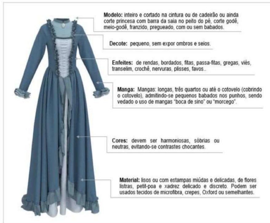
Figura 10 - Vestido Prenda Adulta

acabamento de fita, cortado na cintura, saia godê com babados, comprimento da barra em cima do peito do pé, em tons de verde.