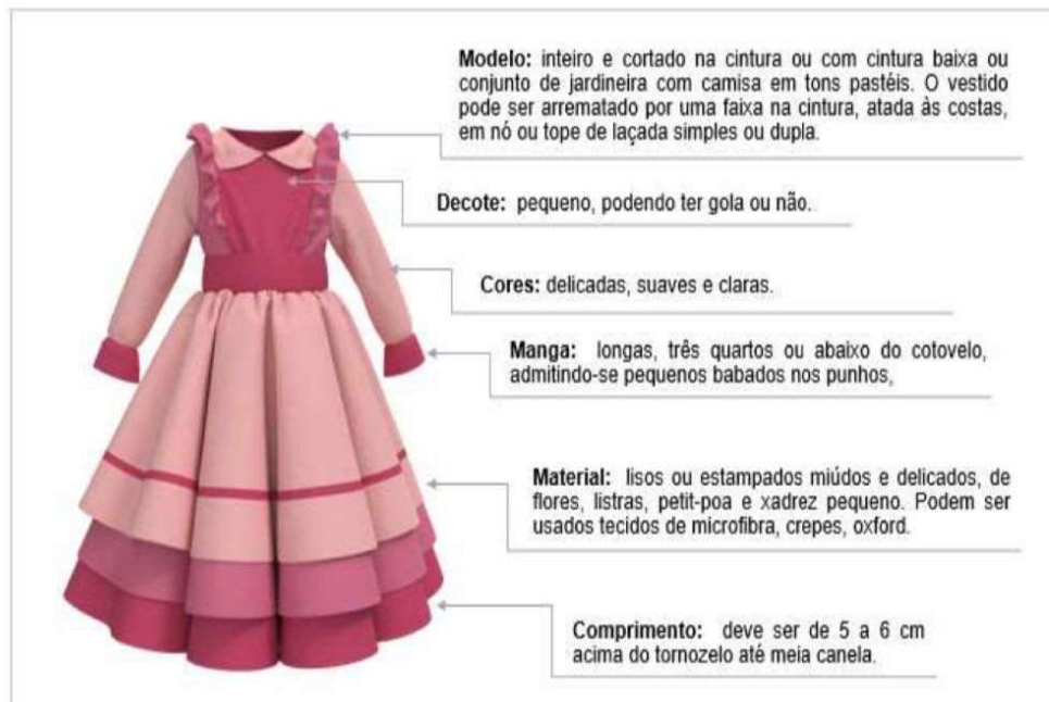
Figura 6 - Vestido da Prenda Mirim