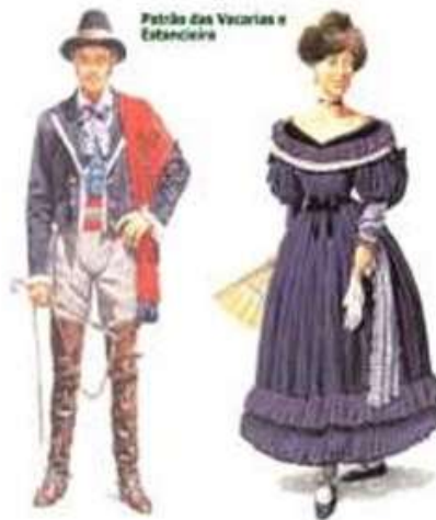
Figura 3 - Traje Patrão das Vacarias e Estancieira (1730 - 1820)