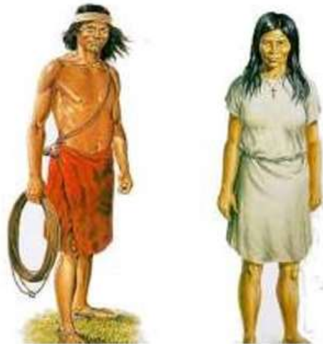
Figura 1 - Traje Indígena (1620-1730)