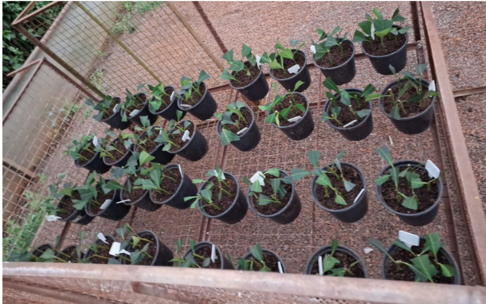
Figura 2 - Vasos utilizados para o plantio, cada vaso comportando 5 estacas de erva-mate.

preparado. As estacas foram colocadas em estufa de irrigação por aspersão automatizada, sendo irrigada 1 minuto a cada hora das 8h da manhã até as 18h.