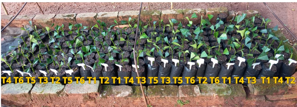
Figura 1 - Distribuição do arranjo experimental.

T1 corresponde a sombra + dose 0; T2 a sombra + 500 \text{ Mg.l}^{-1} ; T3 a sombra + 1000 \text{ Mg.l}^{-1} ; T4 a sol + dose 0; T5 a sol + 500 \text{ Mg.l}^{-1} ; T6 a sol + 1000 \text{ Mg.l}^{-1} .