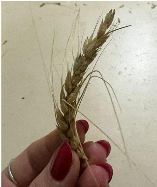
Figura 10 – Espiga de trigo utilizada para avaliação de número de espiguetas por espiga.