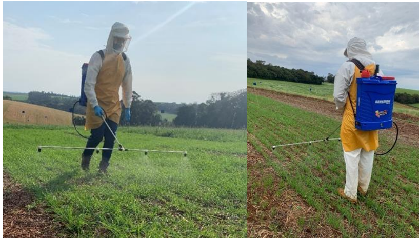
Figura 5 – Aplicação de bioestimulador nitrogenado na cultura do trigo.