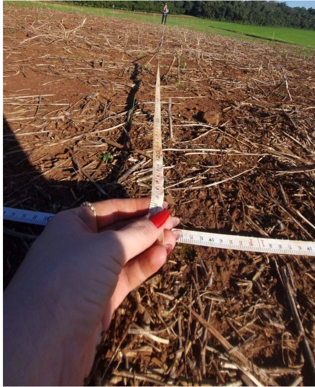
Figura 3. Demarcação da área do experimento.