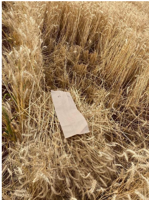
Figura 6 - Área útil colhida na parcela experimental de trigo.