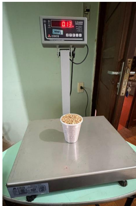
Figura 9 – Balança e medida de volume utilizados para determinação do peso hectolitro de grãos de trigo.