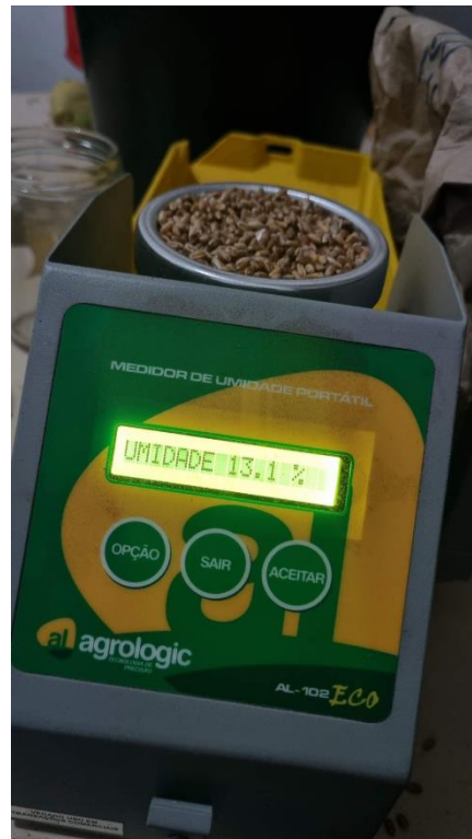
Figura 8 - Aferição da umidade das amostras de grãos de trigo.