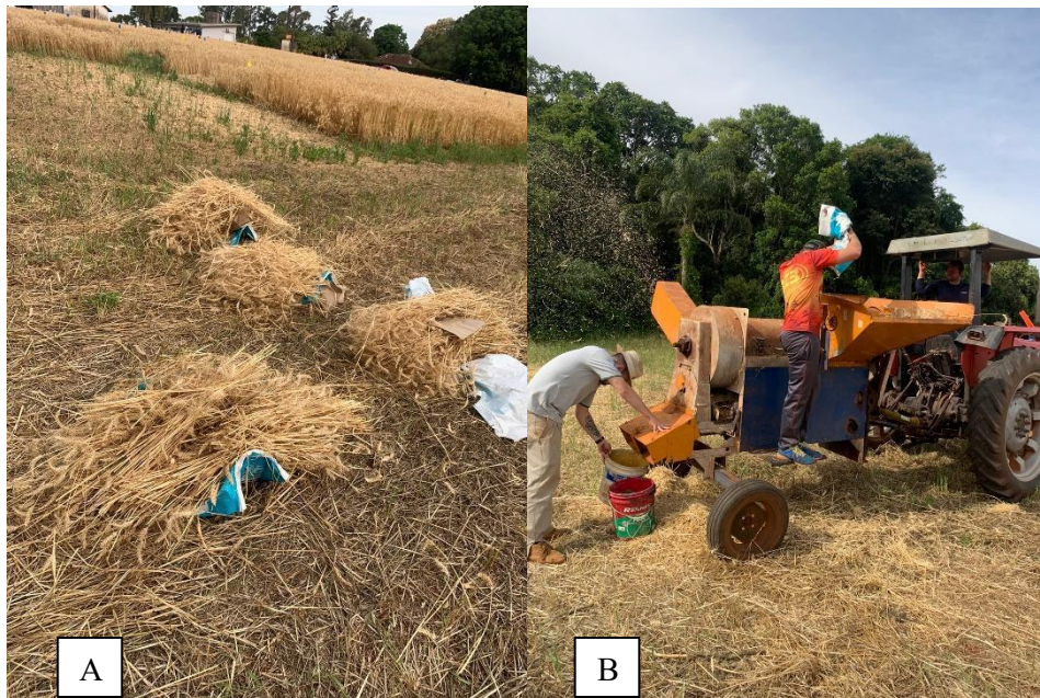
Figura 7 - Coleta (A) e trilha das amostras de trigo (B).