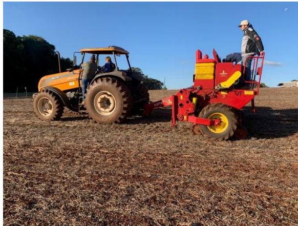
Figura 4 - Realização da semeadura do trigo nas parcelas experimentais.