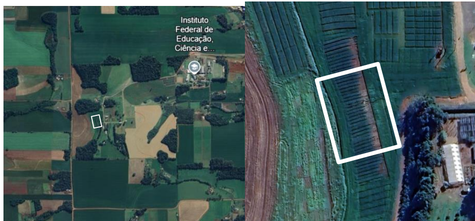
Figura 2 - Localização da área experimental e detalhe da área do experimento.