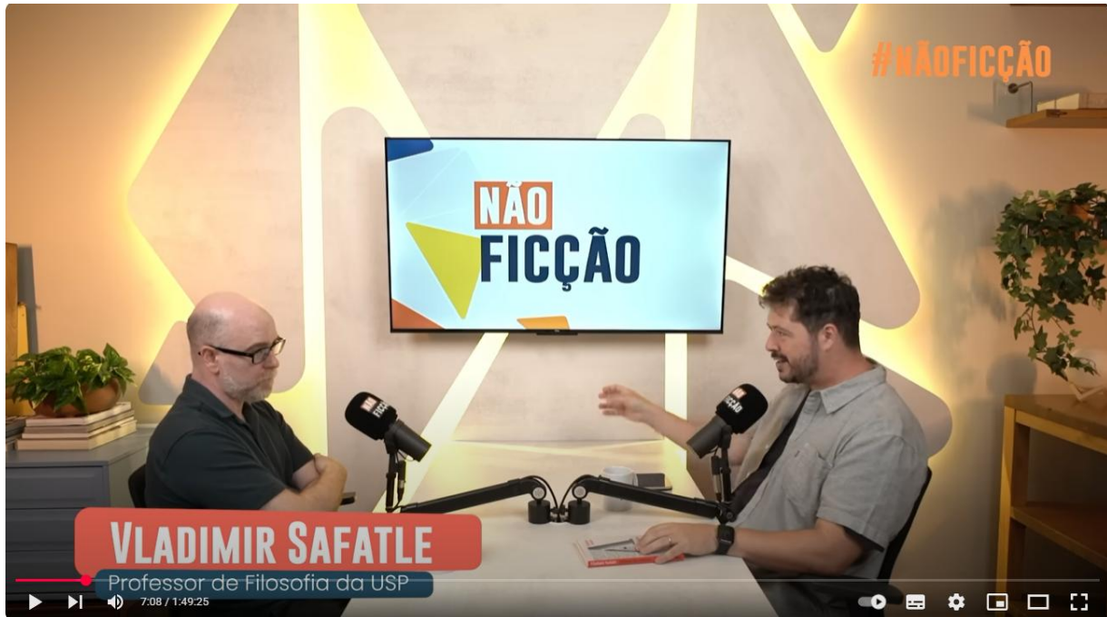
Imagem 11: Podcast: o trabalho é a nova religião 11