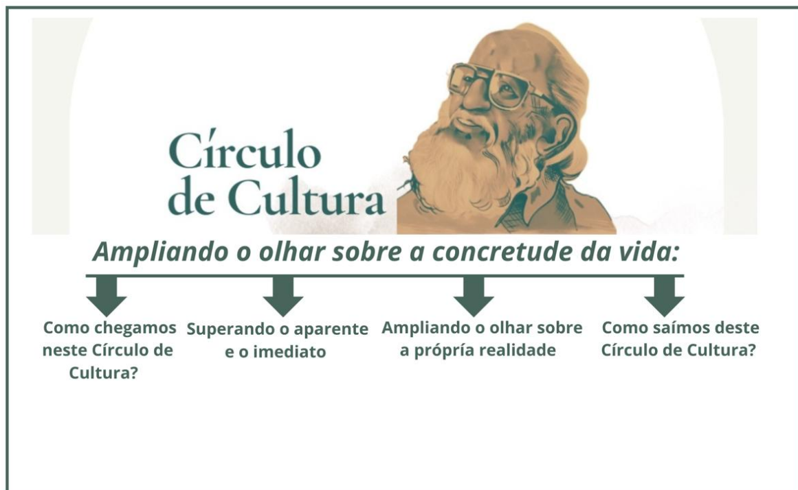
Imagem 6: Linha do tempo construída durante a formação presencial