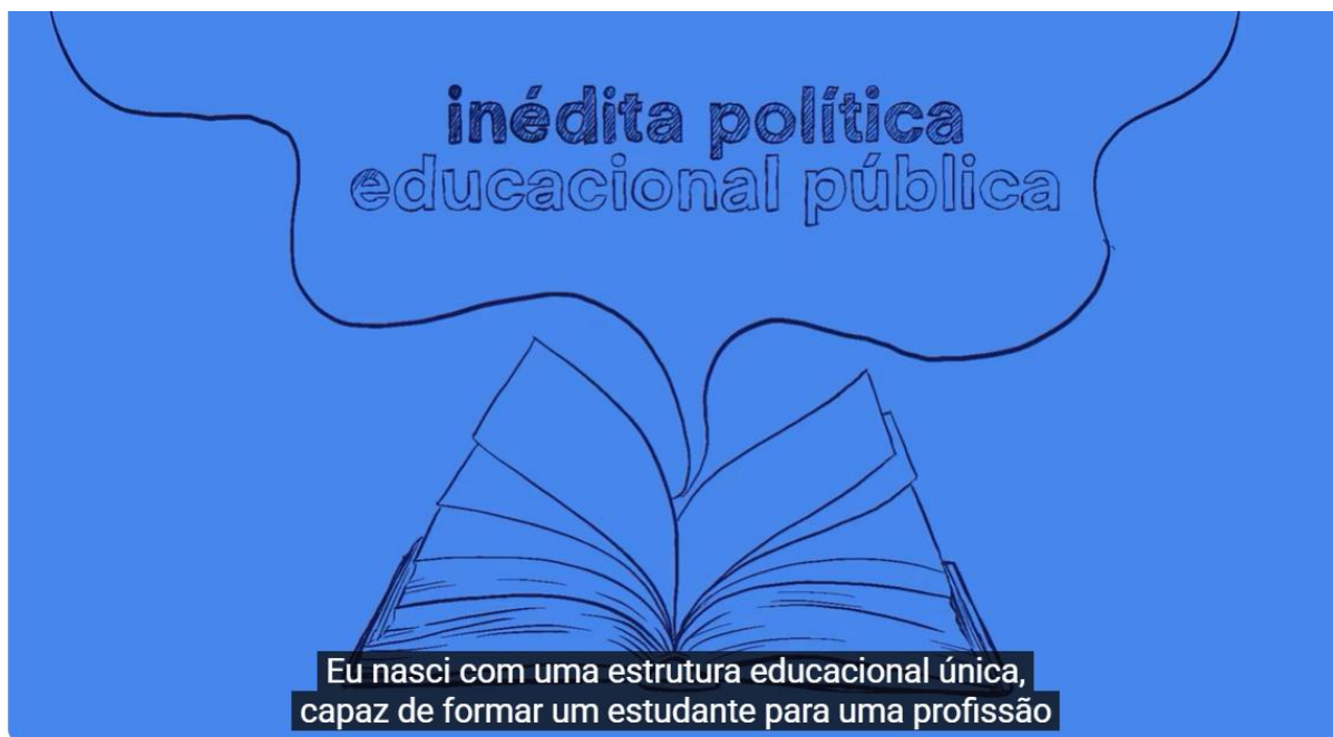
Imagem 7: Mas afinal, o que é um Instituto Federal? 8