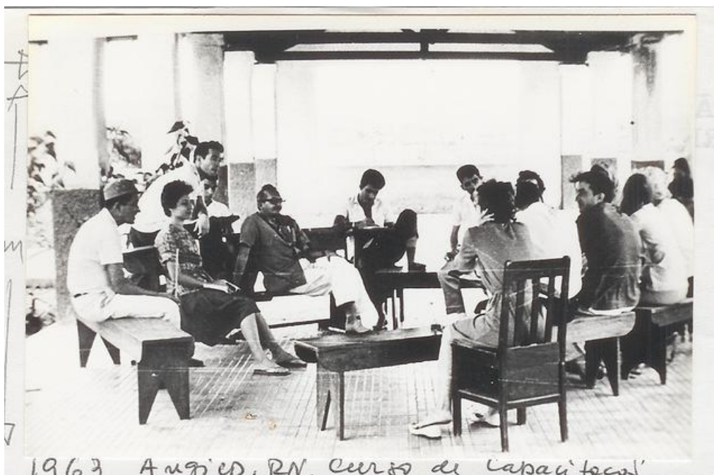
Imagem 2: Encontro com educadores na cidade de Angicos, em 1963 3