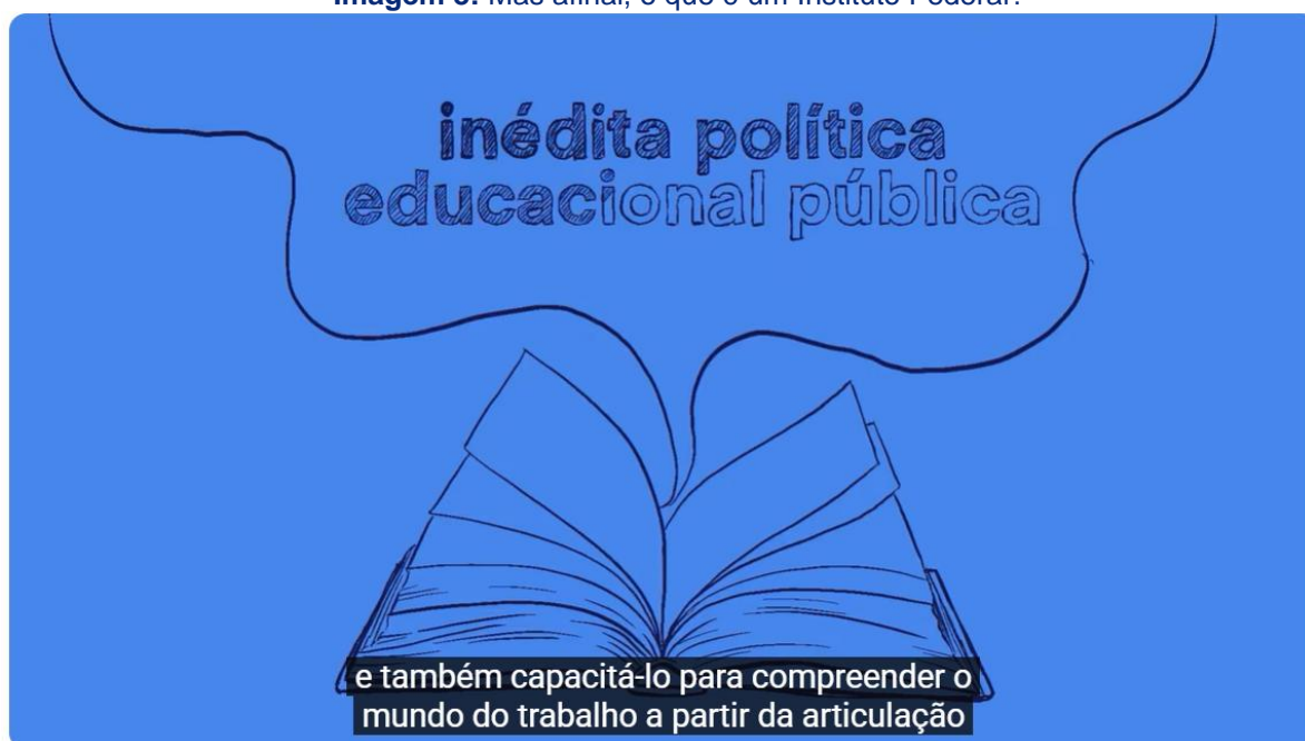
Imagem 8: Mas afinal, o que é um Instituto Federal?