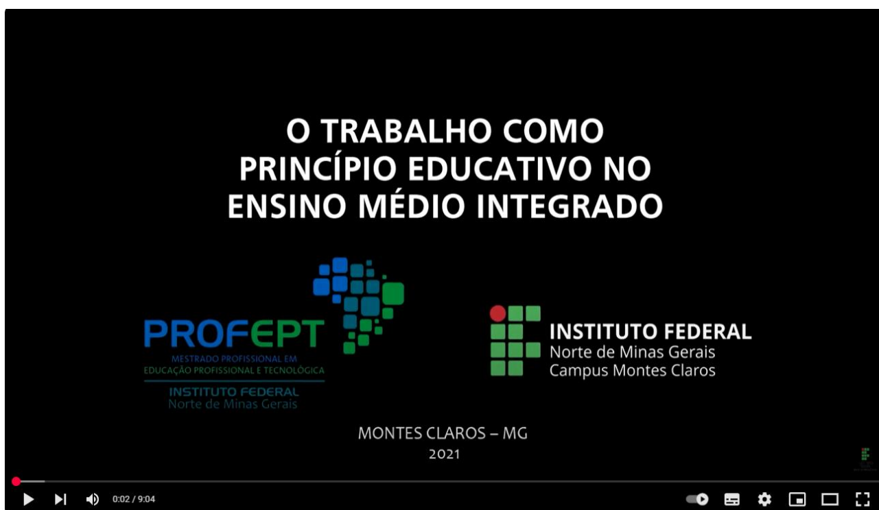
Imagem 10: Videoanimação: o trabalho como princípio educativo 10