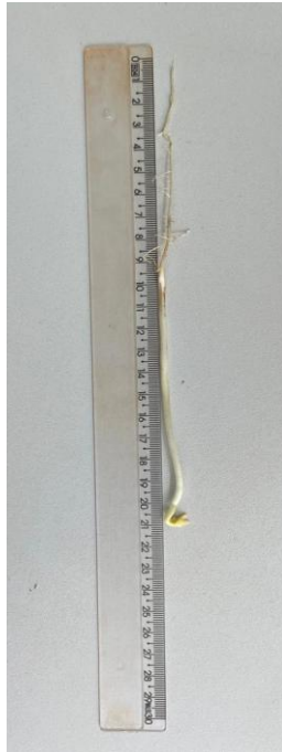
Figura 4 – Determinação do comprimento de plântula.

A massa seca de plântulas foi obtida a partir de 10 plântulas ao final do teste de emergência. As plântulas foram acondicionadas em cápsulas de alumínio e submetidas à secagem em estufa de ventilação forçada a uma temperatura de 65 °C durante 72 horas (Figura 5). Os resultados foram expressos em g por plântula.