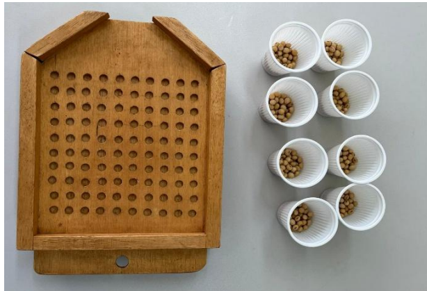
Figura 6 – Contador e repetições para contagem

O peso de 1000 sementes foi determinado pela separação de oito repetições de 100 sementes, pesadas em balança de precisão (0,001g) (Figura 6 e 7), conforme recomendado pelas Regras para Análise de Sementes (BRASIL, 2009 a). Após a pesagem, os valores foram convertidos para peso de 1000 sementes.