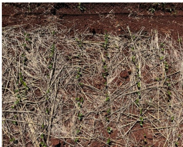
Figura 3 – Canteiros com plântulas emergindo no campo.

A avaliação da porcentagem de emergência das plântulas foi efetuada aos 28 dias após a semeadura, sendo consideradas as plântulas com cotilédones acima de 0,02 m do nível do solo.