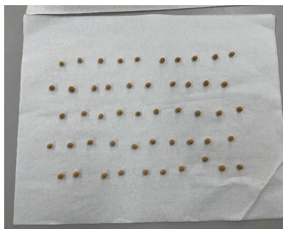
Figura 1 – Sementes dispostas para o teste de germinação.

O teste de germinação, foi realizado com quatro subamostras de 50 sementes, totalizando 200 sementes por repetição. As sementes foram distribuídas sobre papel Germitest umedecido com água destilada na proporção de 3,0 vezes a massa do substrato de papel seco (Figura 1). Os rolos de papel foram acondicionados em um germinador à temperatura de 25° C. As avaliações foram realizadas oito dias após a semeadura, de acordo com as Regras para Análise de Sementes (BRASIL, 2009 a), e os resultados expressos em porcentagem de plântulas normais.