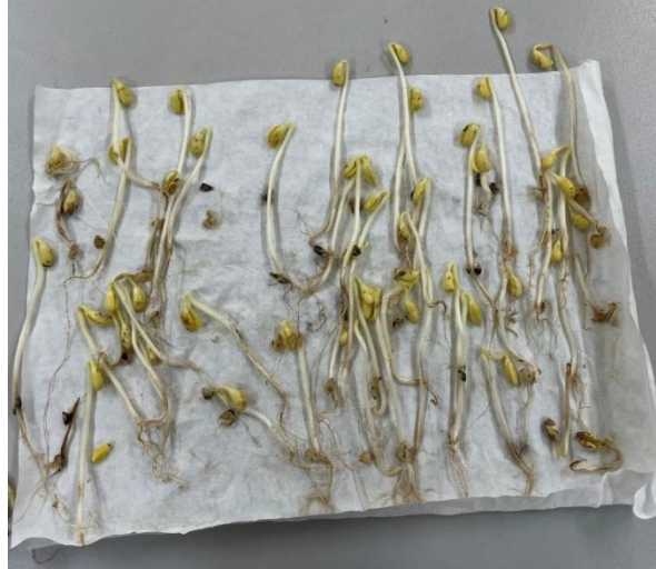
Figura 2 – Plântulas após o teste de germinação.