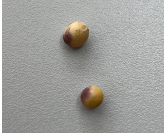
Figura 8 – Sementes com sintomas de Cercospora

Os dados obtidos foram tabulados e posteriormente submetidos à análise de variância, e quando significativo, as médias foram comparadas pelo teste de Tukey a 5% de probabilidade de erro, isto com o auxílio do software Sisvar (FERREIRA, 2019).