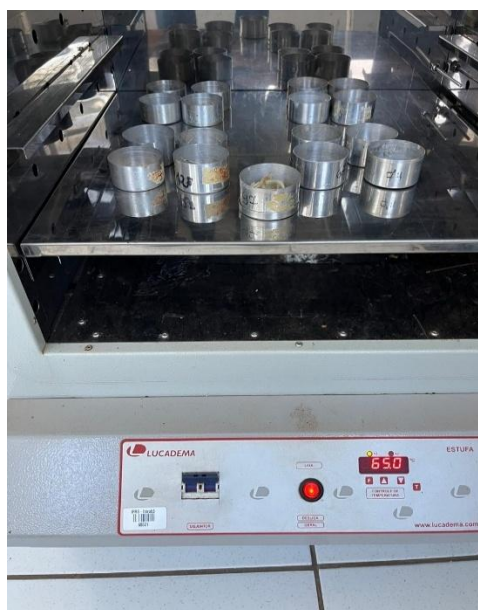
Figura 5 – Estufa para secagem de plântulas

A massa seca de plântulas foi obtida a partir de 10 plântulas ao final do teste de emergência. As plântulas foram acondicionadas em cápsulas de alumínio e submetidas à secagem em estufa de ventilação forçada a uma temperatura de 65 °C durante 72 horas (Figura 5). Os resultados foram expressos em g por plântula.