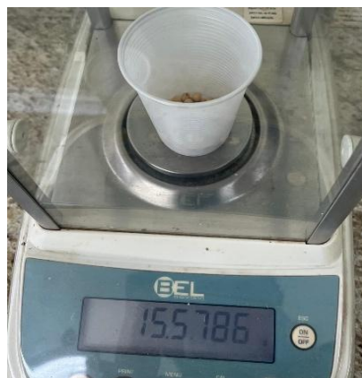
Figura 7 – Balança de precisão para pesagem das sementes