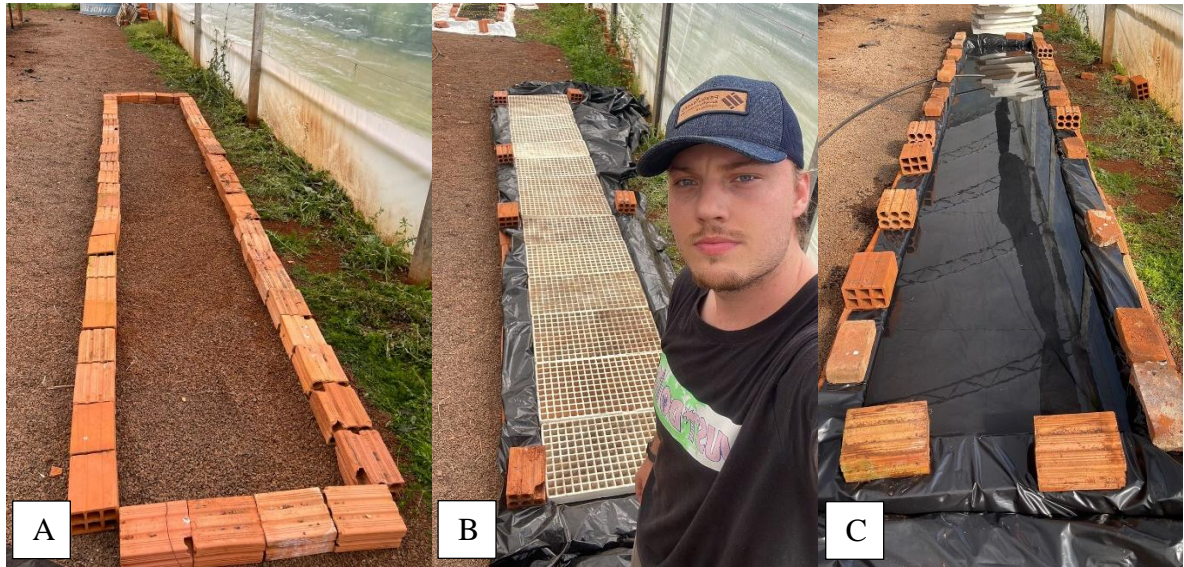
Figura 4 - Construção do sistema floating (A e B). Sistema pronto (C).