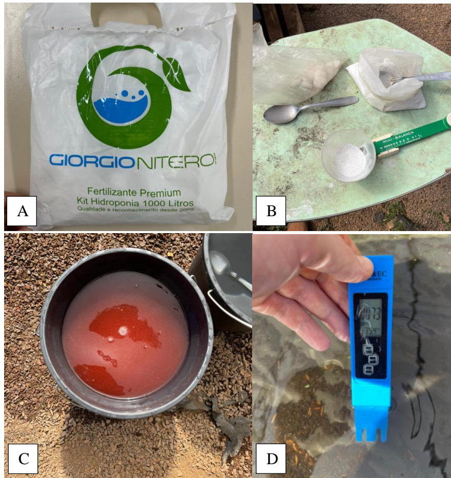
Figura 5 - Fertilizante (A). Pesagem do fertilizante (B). Diluição do fertilizante (C). Medição da água do floating com o condutivímetro (D).