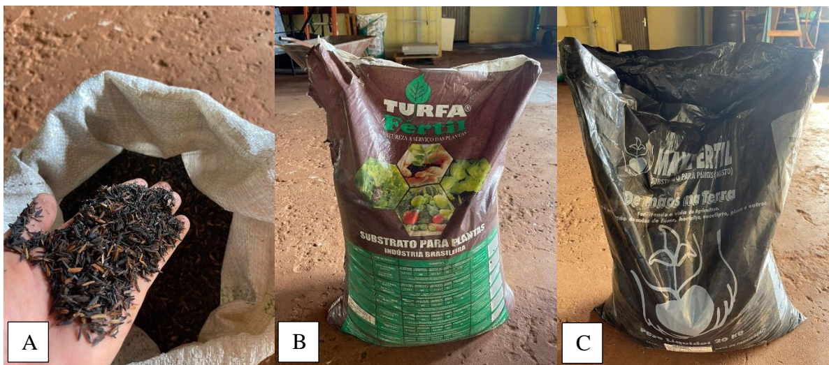
Figura 1 - Substratos usados na produção das mudas de alface. Casca de arroz carbonizada (A). Substrato comercial Turfafétil (B). Substrato comercial Maxifétil (C).

compostada e carbonizada, vermiculita, calcário e aditivos NPK e proporções variáveis de casca de arroz carbonizada da seguinte forma: 100% substrato Turfafétil; 100% substrato Maxifertil; 75% substrato Turfafétil + 25% casca de arroz carbonizada; 75% substrato Maxifertil + 25% casca de arroz carbonizada; 50% substrato Turfafétil + 50% casca de arroz carbonizada; 50% substrato Maxifertil + 50% casca de arroz carbonizada; 100% casca de arroz carbonizada. Cada repetição correspondeu à 50 células de uma bandeja (Figura 1). As cultivares de alface crespa e alface americana utilizadas foram, respectivamente, Samira e Astra ambas da linha de semente TopSeed Premium da empresa Agristar do Brasil.