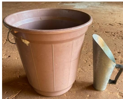
Figura 2 - Balde e medidor usados para misturar os tratamentos.

Para realizar as misturas de substrato e casca de arroz foram usados um balde e um medidor que estabeleceu-se ser 25% da mistura, assim, por exemplo, para a mistura de 75% de substrato e 25% de casca de arroz, usou-se 3 medidas de substrato e uma de casca de arroz (Figura 2).