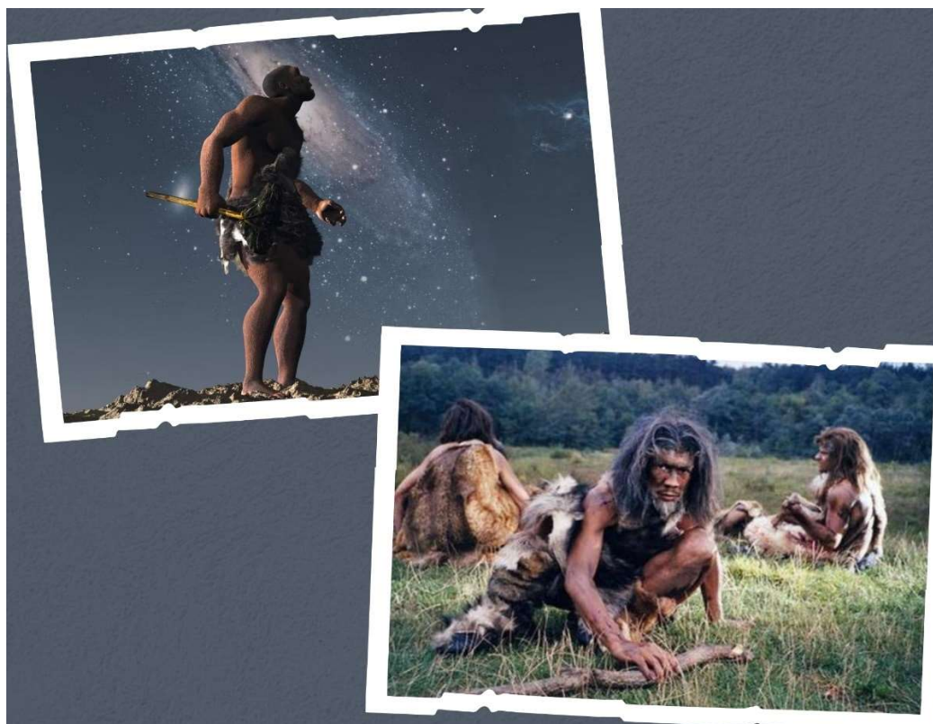
Figura 1: Vestimentas Confeccionadas com Pele de Animais