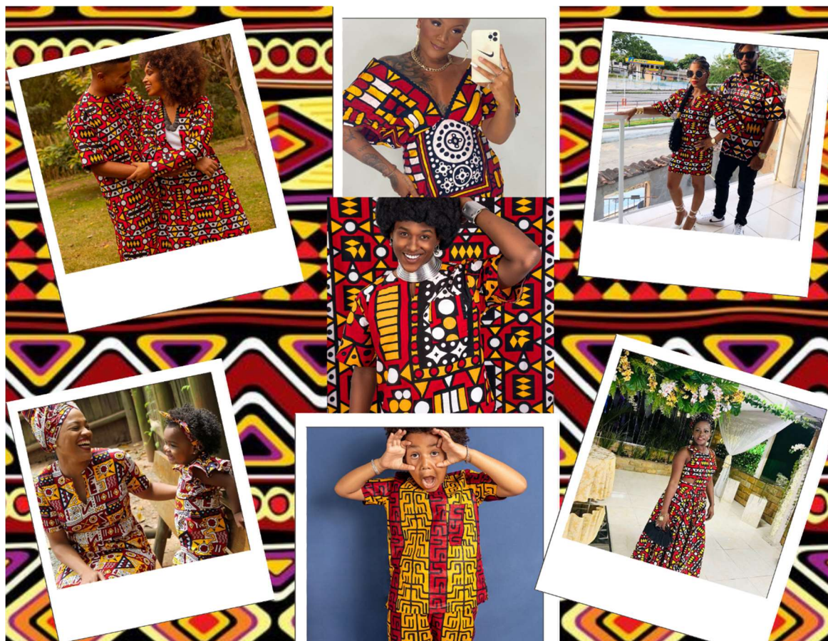
Figura 11: Moda Afrocentrada