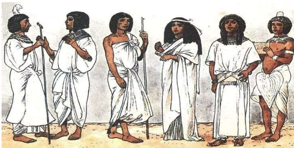
Figura 2: Roupas no Egito Antigo