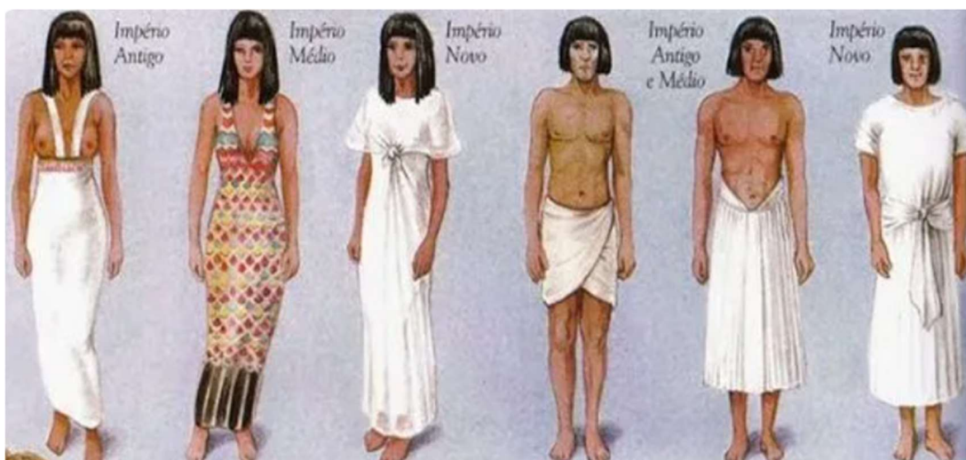
Figura 3: Roupas no Antigo, Médio e Novo Império

À medida que a sociedade egípcia evoluiu, particularmente durante o Médio e o Novo Império, as vestimentas tornaram-se mais elaboradas e complexas, refletindo os avanços na tecelagem e na moda. No Médio Império, as mulheres adotaram vestidos longos de algodão que eram ajustados com cintos, enquanto os homens usavam kilts com pregas mais detalhadas. No Novo Império, a moda alcançou um nível de sofisticação ainda maior com a incorporação de perucas elaboradas, vestidos adornados com contas e joias, e uma maior diversidade nos estilos de roupas, simbolizando tanto a riqueza quanto a posição social. Esta era da moda egípcia é frequentemente a mais retratada em representações modernas devido à sua distinção visual e riqueza de detalhes. (Mark, 2017).