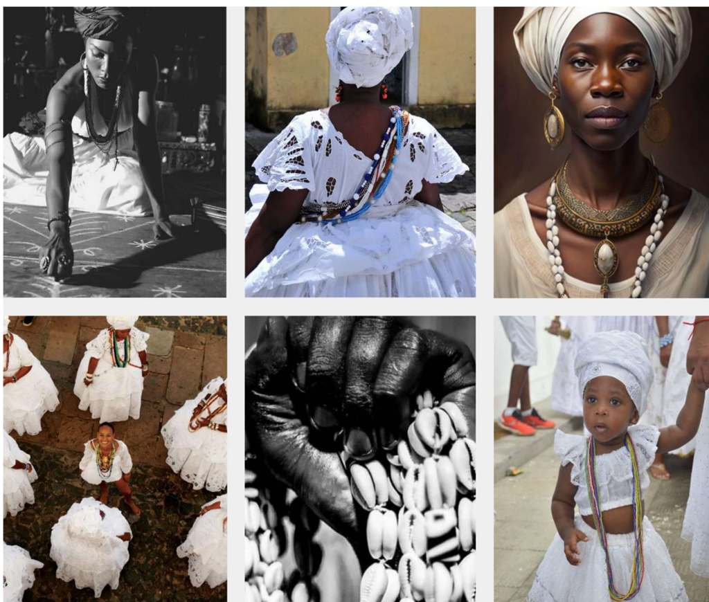
Figura 8: Ilustrações de Mulheres Usando Trajes Religiosos de Matriz Africana