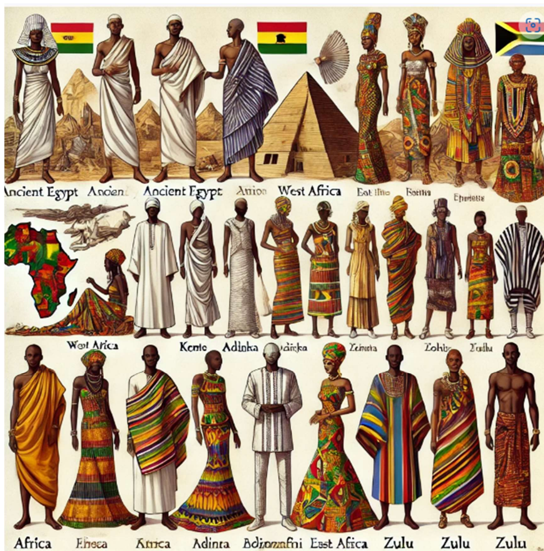
Figura 4: Diversidade da Moda Africana ao Longo da História