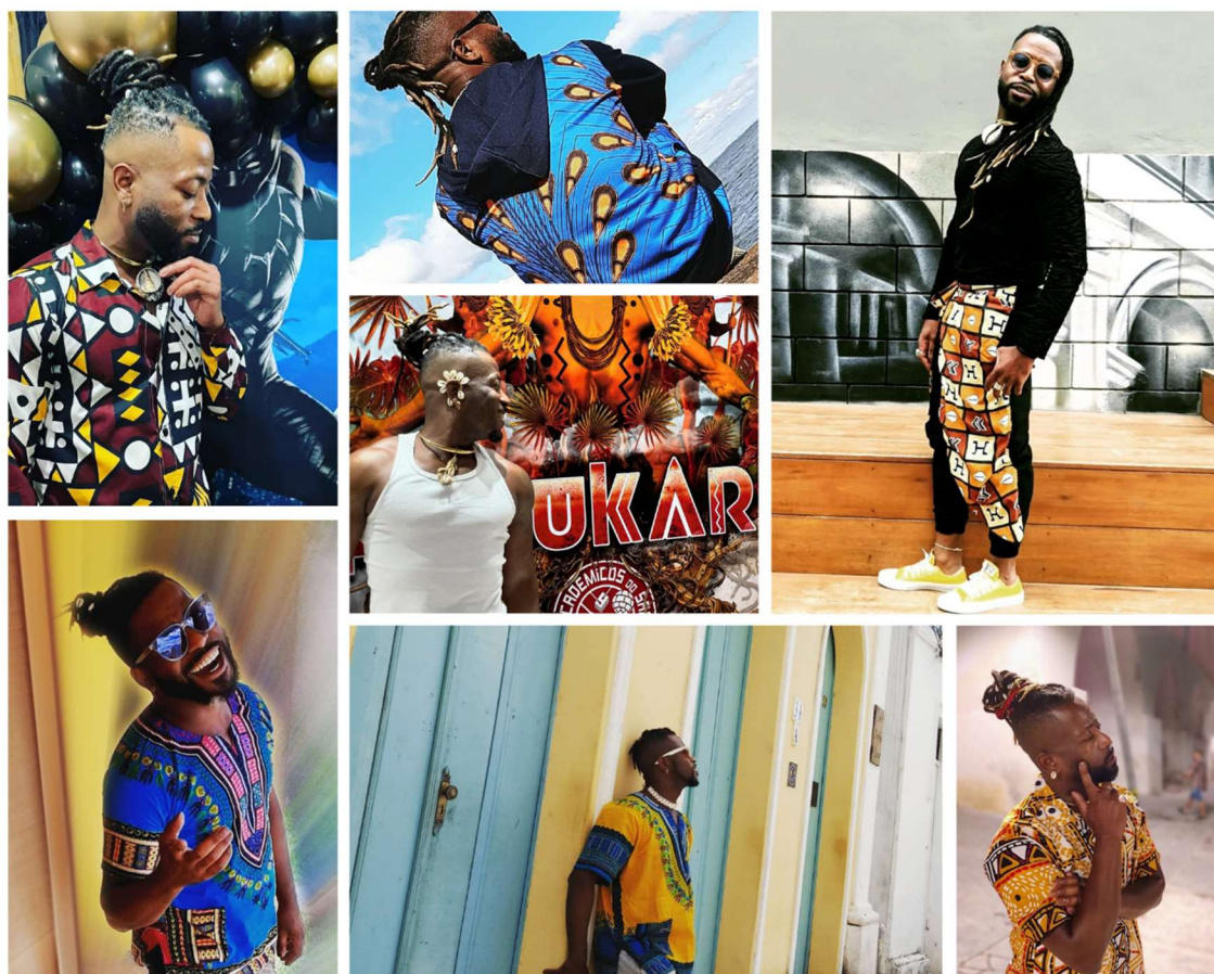
Figura 10: Diversidade de Expressões da Moda Afrocentrada