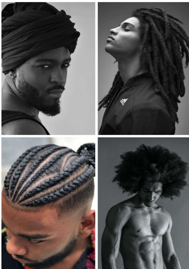
Figura 9: Diversidade de Estilos Afrocentrados: incluindo cortes de cabelo crespo, tranças, dreads e turbantes, que expressam a identidade negra.