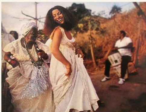
Figura 5: Cantora Clara Nunes - usando acessórios e roupa afrocentrada

A cantora Clara Nunes, que fez sucesso nos anos 70, tornou-se um ícone de resistência e identidade cultural ao promover e valorizar a cultura afro-brasileira através de trajes afrocentrados.