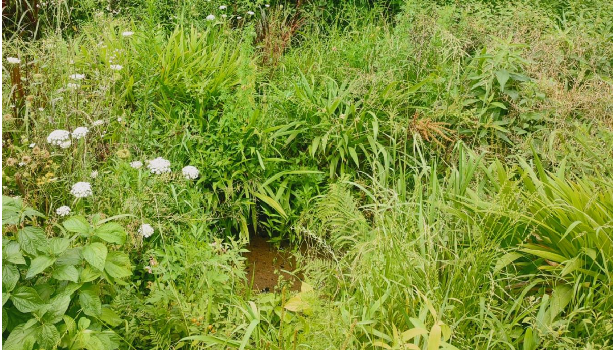
Figura 14 - Nascente em propriedade de Lizandro Lazzari, localidade de São Gabriel