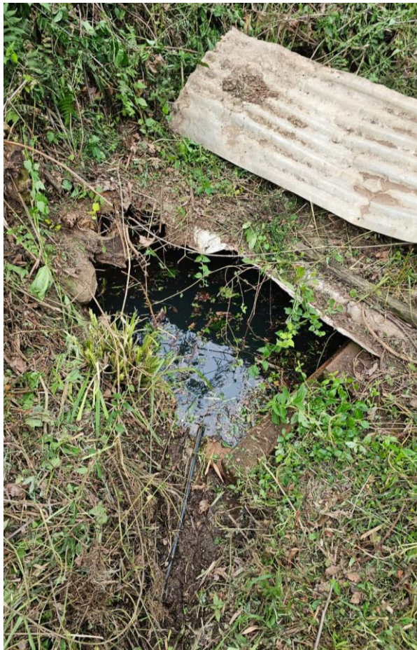
Figura 15 - Nascente em propriedade de Luiz Chassot, localidade de Garibaldina