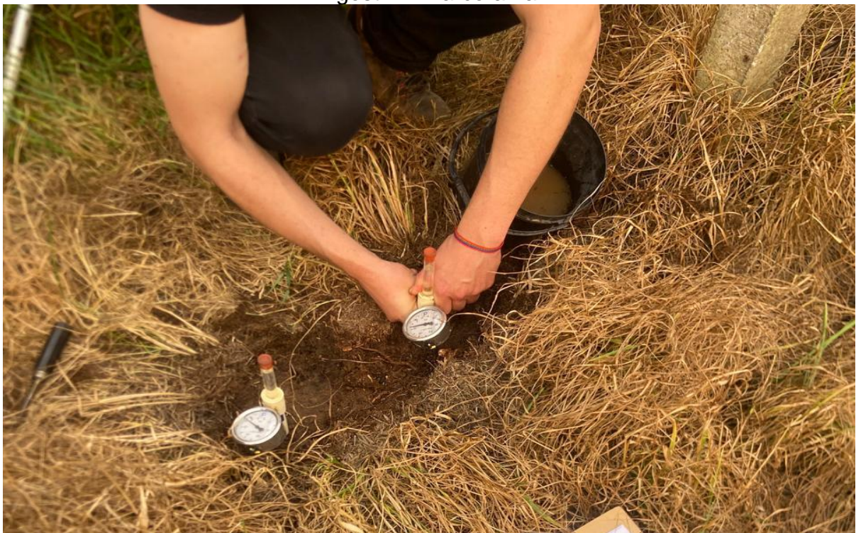
Figura 6 - Instalação de tensiômetros na propriedade de Marcos Agostini e Adriana Agostini - Marcorama

Os tensiômetros foram instalados no dia 12/10/2024 (Figura 6).