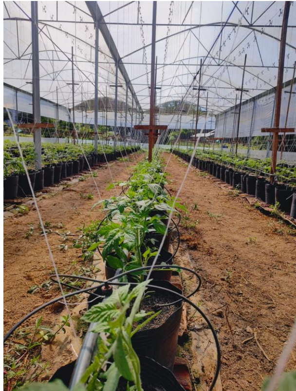
Figura 18 - Tomateiro em fase de tutoramento