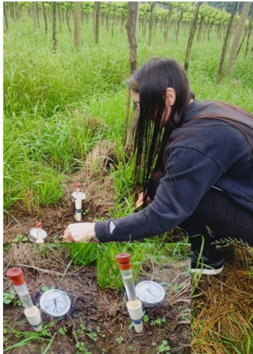
Figura 8 - Primeiro monitoramento dos tensiômetros instalados, realizado no dia 22 de setembro de 2024

Foram realizadas, durante o período de estágio, 3 monitoramentos aos tensiômetros instalados na propriedade. A primeira conferência foi feita no dia 22 de setembro de 2024 (Figura 8).