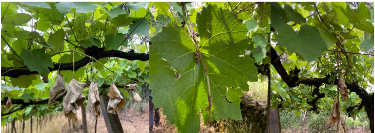
Figura 22 - Danos causados por granizo em folhas e ramos de videira. Parreirais localizados na propriedade de Valmir Ferranti - Coronel Pilar

No momento da vistoria pode ser observado os danos (Figura 22) causados pela intempérie.