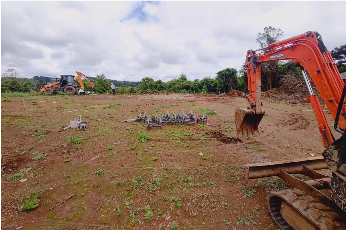
Figura 12 - Local de instalação do silo na propriedade de André Bortolini