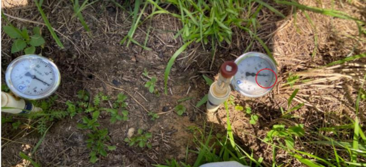
Figura 10 - Terceiro monitoramento dos tensiômetros instalados, realizado no dia 22/10/2024

No dia 22 de outubro de 2024 realizei a terceira verificação o tensiômetro instalado a 20 cm de profundidade apresentou valores próximos a 40 Kpa (Figura 10).