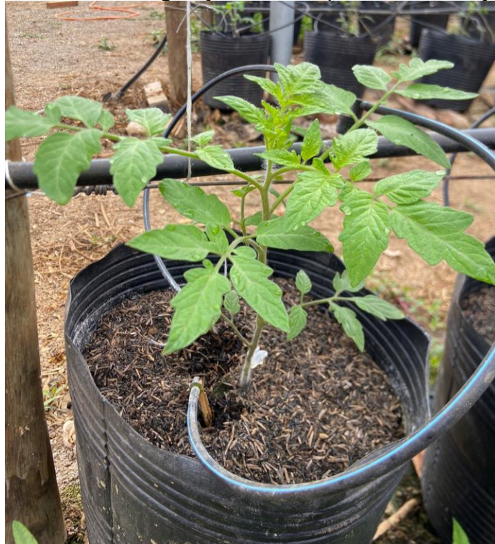
Figura 17 - Muda de tomateiro transplantada em substrato de casca de arroz carbonizada em casa de vegetação, 7 dias após recomendações técnicas

O produtor seguiu as recomendações e no retorno à propriedade, 7 dias após, as mudas apresentavam melhora (Figura 17).