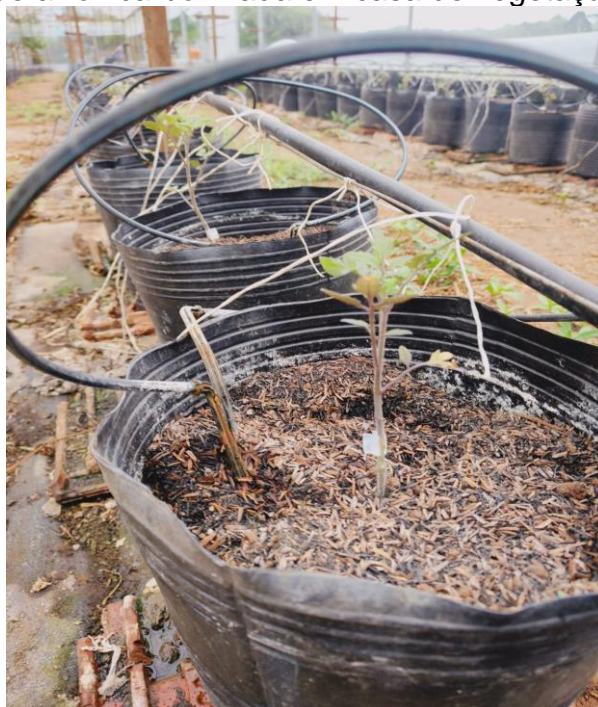
Figura 16 - Muda de tomateiro aos 10 dias após transplante em substrato de casca de arroz carbonizada em casa de vegetação

Em visita técnica solicitada pelo produtor, o mesmo relatou que realizou o plantio de mudas de tomate 10 dias anterior à visita e questionou ao técnico da Emater, quanto ao lento desenvolvimento das mesmas (Figura 16).