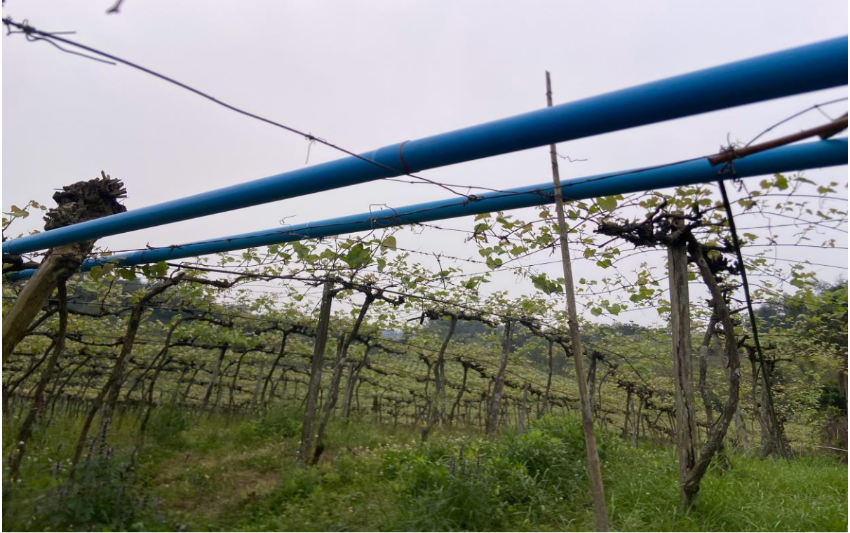
Figura 5 - Instalação de sistema de irrigação localizada na propriedade de Sérgio Parmegiani