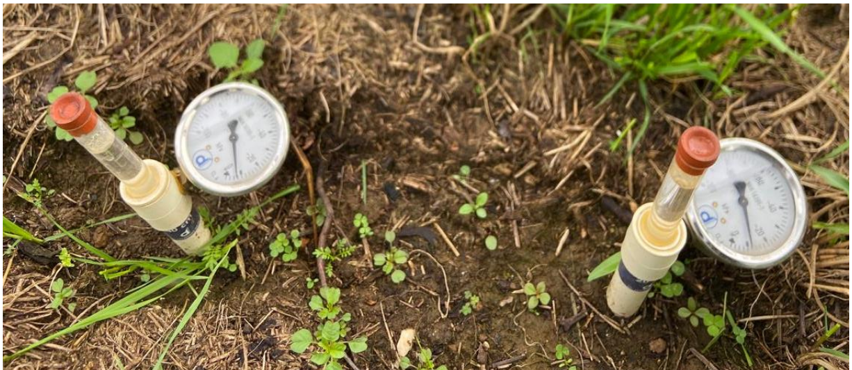
Figura 9 - Segundo monitoramento dos tensiômetros instalados, realizado no dia 07 de outubro de 2024

A segunda conferência foi feita no dia 07 de outubro de 2024. (Figura 9).