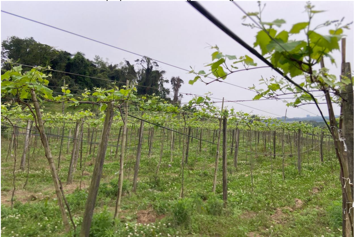
Figura 4 - Instalação de linhas de derivação do sistema de irrigação localizada na propriedade de Sérgio Parmegiani

SIOUT de um projeto de irrigação localizada de 6,27 hectares de parreira na propriedade do agricultor Sérgio Parmegiani, na localidade de São José de Costa Real.