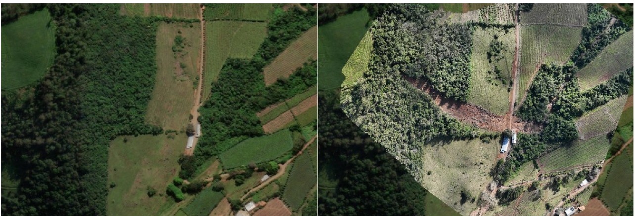
Figura 9: Área antes e depois do deslizamento em área rural no município de Pinto Bandeira.

Durante o estágio, foi utilizado como referência para avaliar os deslizamentos que ocorreram nesse ano, possibilitando comparar as imagens aéreas antes da tragédia com as imagens do drone.