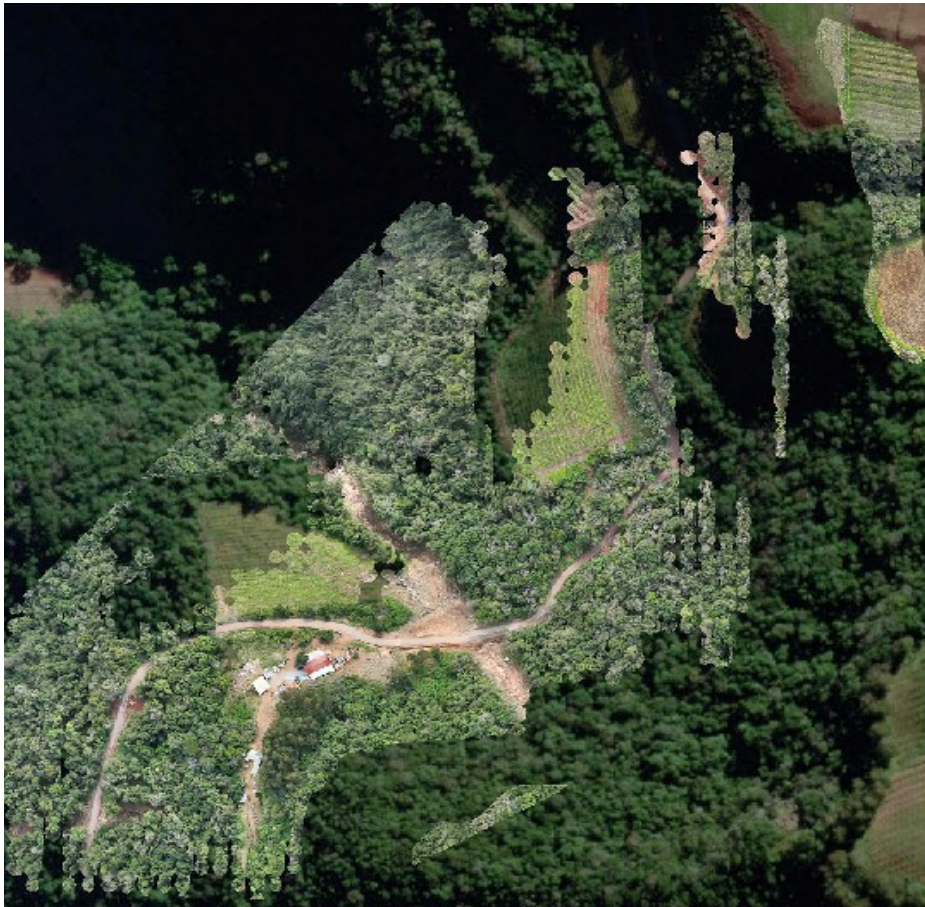
Figura 10: Imagem do drone sobreposta na imagem do Google Earth em área rural no município de Pinto Bandeira.

drenagem, retalutamento de encosta, remoção de blocos soltos, protocolos de emergência, além do grau de risco.