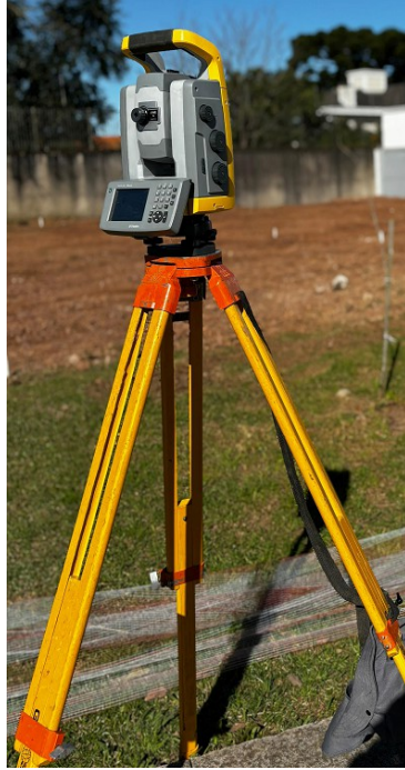
Figura 6: Estação Total Trimble S6.

A empresa dispõe da estação total Trimble S6, mini prisma, prisma 360° e bastões topográficos para a realização do trabalho de coleta e monitoramento de dados. A Estação Total Trimble S6 possui uma precisão angular de 3" e uma precisão linear de 1mm + 2 ppm, considerada de alta precisão.