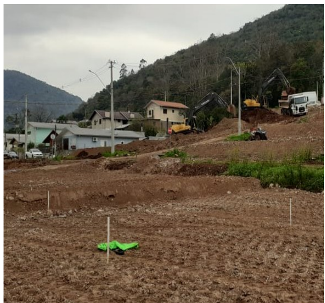
Figura 3: Área compactada antes da aplicação do macadame.