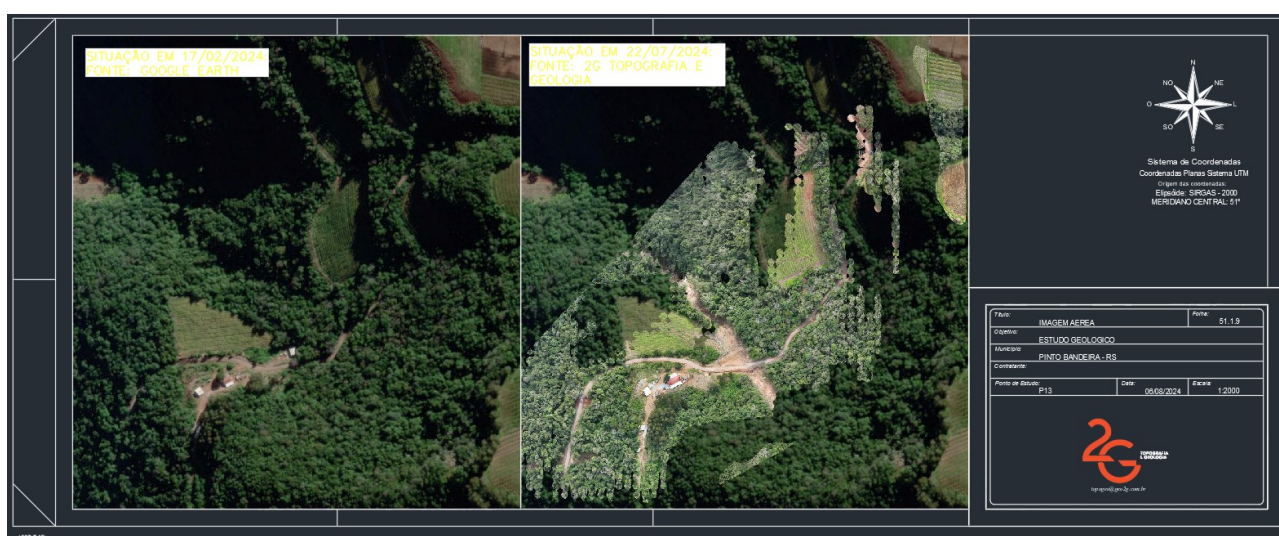
Figura 11: Projeto no AutoCAD: comparativo da área antes e depois do deslizamento em área rural no município de Pinto Bandeira.

No estágio, tive a oportunidade de trabalhar um pouco no Software, realizando alguns projetos relacionados aos deslizamentos.