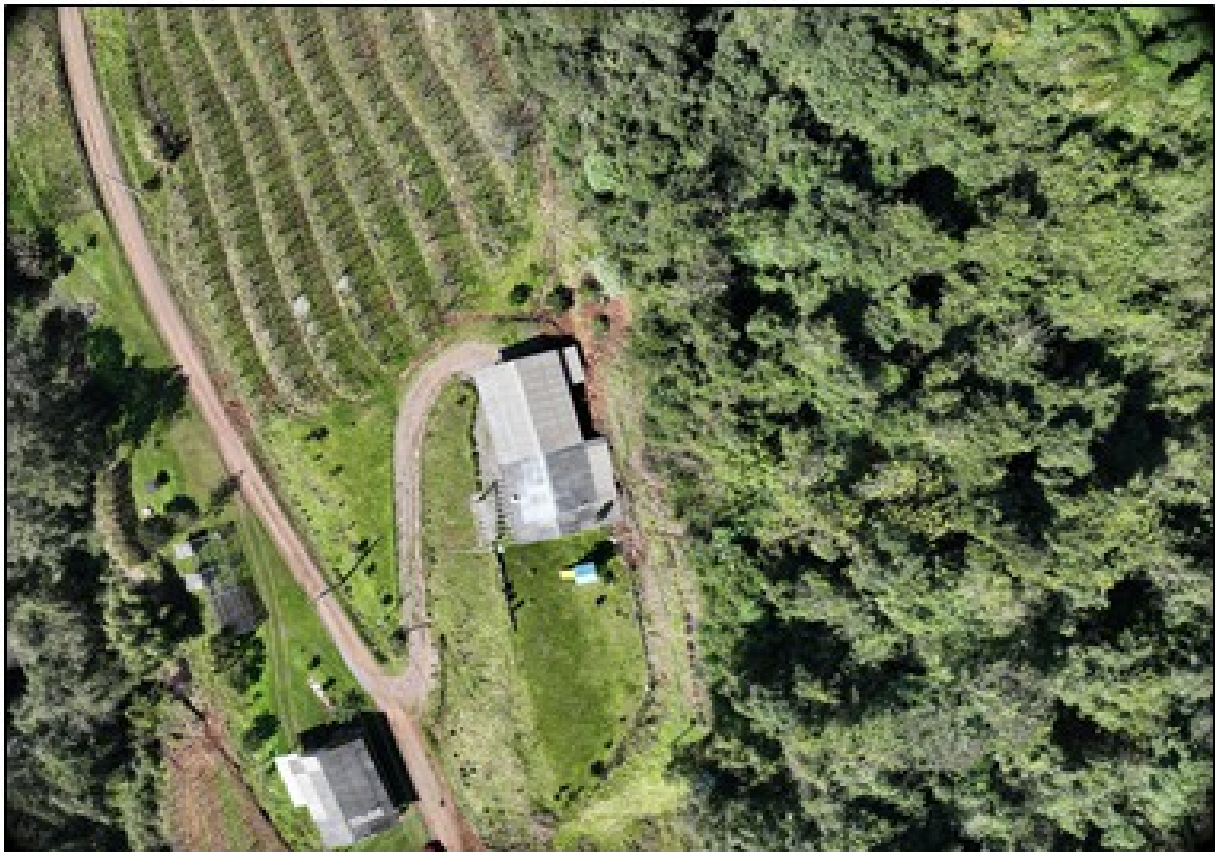
Figura 4: Área rural atingida por deslizamento no município de Pinto Bandeira.