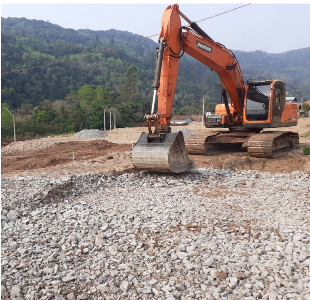
Figura 2: Escavadora espalhando macadame.

Além dos pontos marcados, realizamos também a medida dos níveis das estacas utilizando a Estação Total, marcando na estaca com auxílio de uma trena, os níveis de macadame, onde foi lançado sobre o terreno compactado camadas de pedra britada que, em seguida, foram comprimidas utilizando um rolo compactador de solo (Figuras 2 e 3). Além disso, foram marcados os níveis de pó de brita, que tem a função de corrigir as superfícies irregulares do macadame.