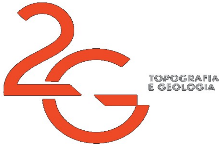
Figura 1: Logomarca da empresa 2G Topografia e Geologia.

A 2G Topografia e Geologia faz serviços para prefeituras, como as de Pinto Bandeira, Santa Tereza, Garibaldi, entre outras, além de serviços particulares (Figura 1).