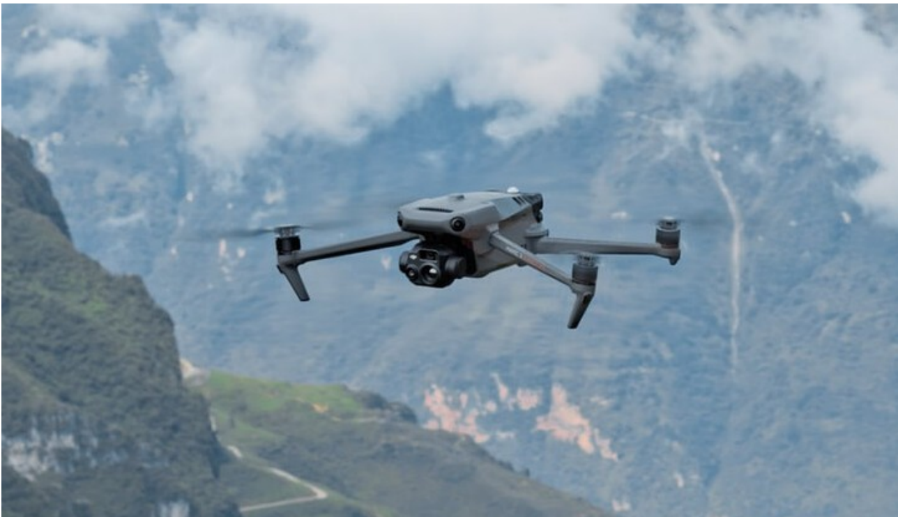
Figura 8: Drone DJI Mavic 3 Enterprise.

Além disso, O DJI Mavic 3 Enterprise vem equipado com uma câmera com sensor 4/3 CMOS de 20 MP, possibilitando capturar imagens detalhadas em alta qualidade, seja para mapeamento, inspeção de infraestrutura ou monitoramento ambiental, com um zoom de até 56 x.