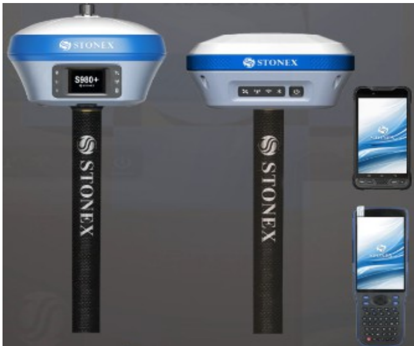
Figura 7: Receptor GNSS S980; Receptor GNSS S850; Coletoras de dados.

O equipamento também possui uma porta 1PPS que pode ser utilizada em aplicações que requerem temporização precisa para garantir operação conjunta de vários instrumentos ou utilizando os mesmos parâmetros para integração de sistemas com base em temporização precisa.