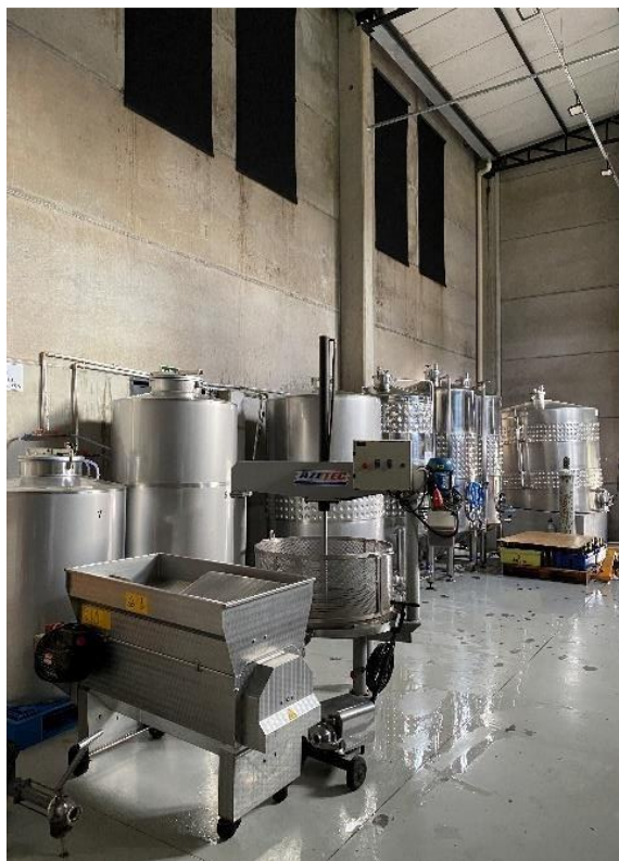
Figura 1. Área de elaboração e equipamentos limpos para receber as uvas.