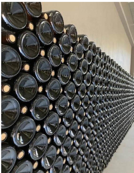
Figura 17. Garrafas empilhadas e envelhecendo na cave.