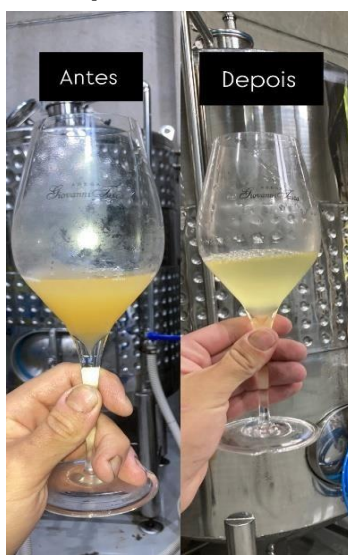
Figura 9. Comparação antes e depois da deboubage em mosto de Alvarinho.

Após o período de decantação, pode-se fazer uma comparação entre as duas amostras. Abaixo, apresenta-se o antes e depois do processo de clarificação dos mostos (Figura 9).