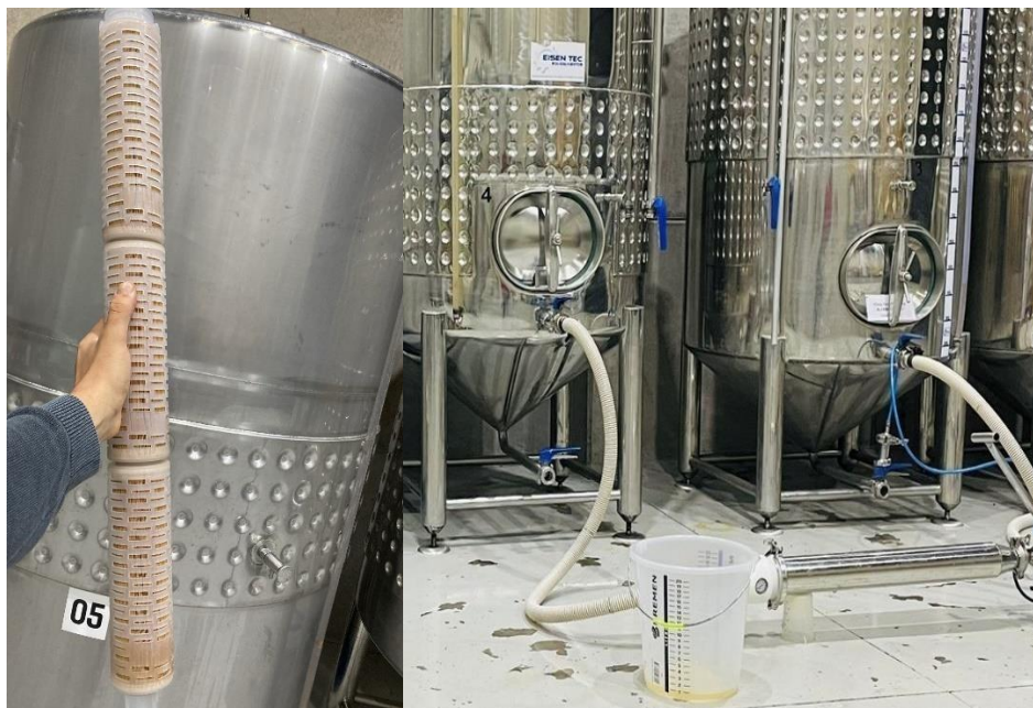
Figura 15. Processo de filtração com membrana de 0,45 micra.