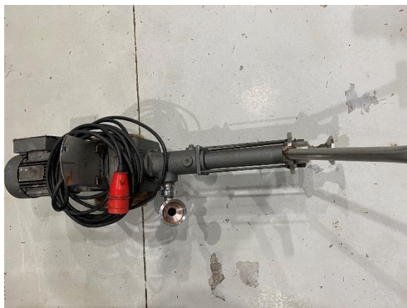
Figura 13. Bomba helicoidal utilizada nas trásfegas.

Essas trásfegas são realizadas por meio de bombas (Figura 13). Utiliza-se a bomba helicoidal durante todo o processo de vinificação do Alvarinho, com a finalidade de não o oxigenar, pois esse estilo de bomba não provoca nenhuma oxidação.