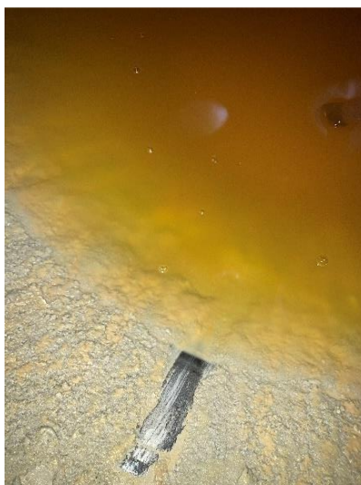
Figura 14. Depósito de borras e cristais formados pela estabilização do vinho Alvarinho.

Na Giovanni Tasca (Figura 14), o vinho é mantido em temperaturas controladas, geralmente entre 2°C e 0°C, por um período de tempo que pode variar dependendo inclusive da acidez do vinho, mas ocorre normalmente por 30 dias, sem o auxílio de coadjuvantes. Depois desse período, é analisado em laboratório a estabilidade tartárica, onde o laboratório caracteriza a amostra em quatro tópicos: Muito estável (saturação abaixo de 25), estável (saturação entre 25 e 40), risco de instabilidade (saturação entre 40 e 60) e instável (saturação maior que 60). Na vinícola, somente é engarrafado um vinho que esteja muito estável.