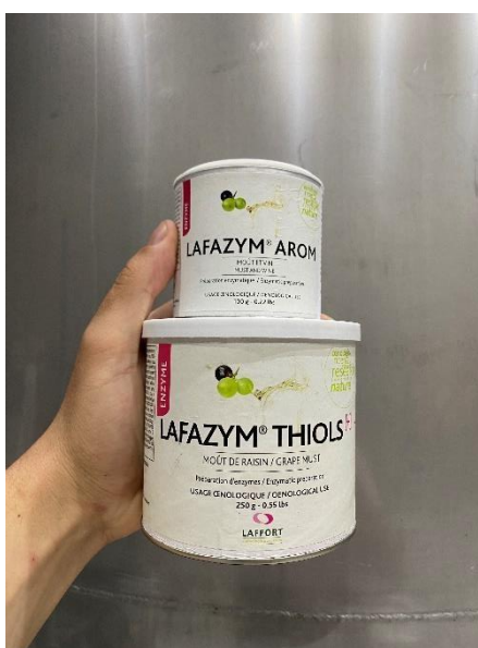
Figura 6. Enzimas comerciais utilizada.

também pode afetar a eficácia das enzimas que são adicionadas para melhorar a extração de compostos das uvas e auxiliar na clarificação do vinho. Para garantir que as enzimas funcionem de maneira eficaz, é ideal permitir que o SO 2 atue completamente antes de adicionar as enzimas de modo a dar tempo ao SO 2 de se combinar com açúcares e o oxigênio (JACKSON, 2014).