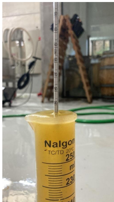
Figura 12. Acompanhamento diário da densidade durante a fermentação alcoólica.