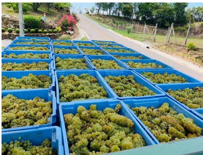
Figura 4. Carregamento das uvas no caminhão.

Na chegada da uva no estabelecimento enológico devem ser realizados alguns controles iniciais que servem para registrar as uvas, e ainda obter informações sobre alguns parâmetros da matéria prima e do mosto, que servem como uma primeira orientação de vinificação (GIOVANNINI; MANFROI, 2009).