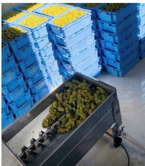
Figura 7. Desengace da uva branca.

Esse processo, na Giovanni Tasca, ocorre na vinificação da variedade branca Alvarinho que passa por um processo de maceração pré-fermentativa a frio.