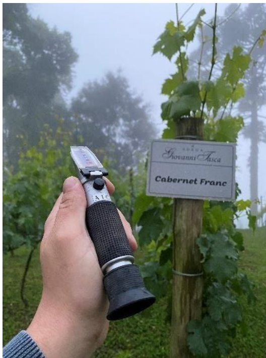
Figura 2. Uso do refratômetro para acompanhamento de maturação das uvas no vinhedo.