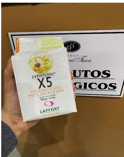
Figura 11. Levedura comercial utilizada na fermentação de vinhos brancos aromáticos na Vinícola Giovanni Tasca.