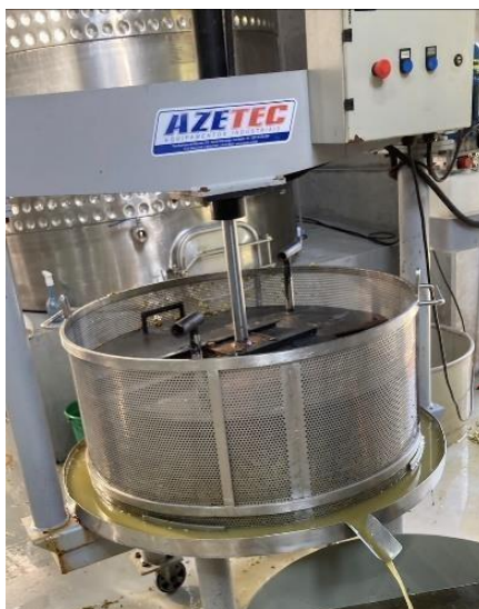
Figura 8. Prensa vertical utilizada na Vinícola Giovanni Tasca.

tem eficácia e não resulta em um bom rendimento quando a uva é prensada inteira. A imagem expõe como é realizado o processo de prensagem na vinícola.