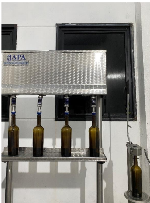
Figura 16. Enchedora semiautomática e arrolhador manual.

Para iniciar o engarrafamento, todos os equipamentos são ajustados para o tipo específico de garrafa e são limpos e esterilizados antes do uso. O vinho é transferido do tanque para a enchedora por gravidade, sendo controlado por uma boia que impede o transbordamento. As garrafas novas são enxaguadas com água filtrada, isenta de cloro, e, em seguida, são preenchidas com o vinho de forma rápida e estéril para reduzir o contato com o oxigênio. O espaço entre o vinho e a rolha é ajustado conforme a ficha técnica da garrafa, geralmente entre 1,5 e 2 cm. Após o enchimento (Figura 16), as garrafas são vedadas com rolhas e armazenadas em pé nos pallets para permitir que as rolhas se expandam e se ajustem adequadamente, garantindo uma vedação eficaz.