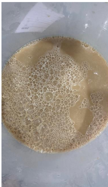
Figura 10. Ativação das leveduras na preparação do pé de cuba.