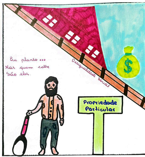
Figura 8: Charge 8 (C8)