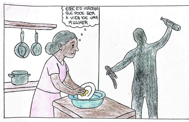
Figura 2: Charge 2 (C2)

Nas charges seguintes, as charges C2 (Estudantes 5 e 6, Turma B) (Figura 2), C3 (Estudantes 7 e 8, Turma B) (Figura 3) e C4 (Estudantes 9 e 10, Turma B) (Figura 4) abordam a mesma temática representando a violência que a personagem Belonísia sofria de seu companheiro Tobias.