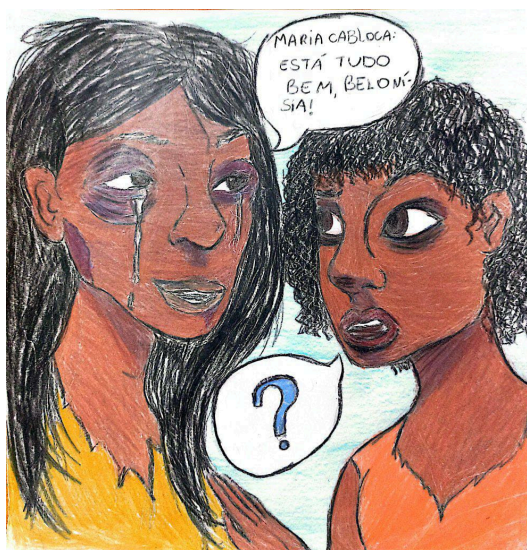
Figura 1: Charge 1 (C1)