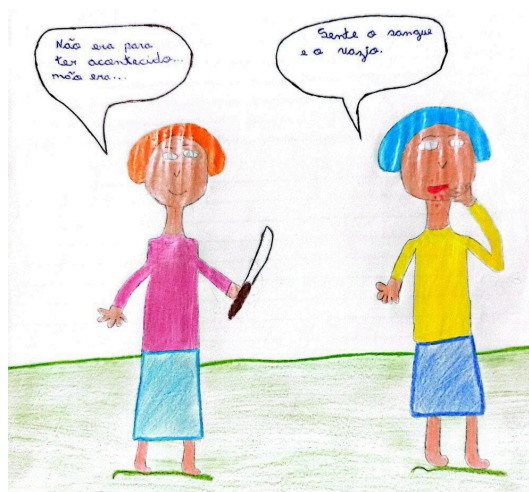
Figura 15: Charge 15 (C15)