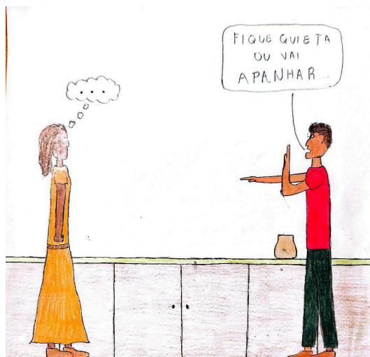
Figura 4: Charge 4 (C4)