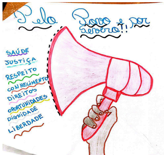
Figura 12: Charge 12 (C12)