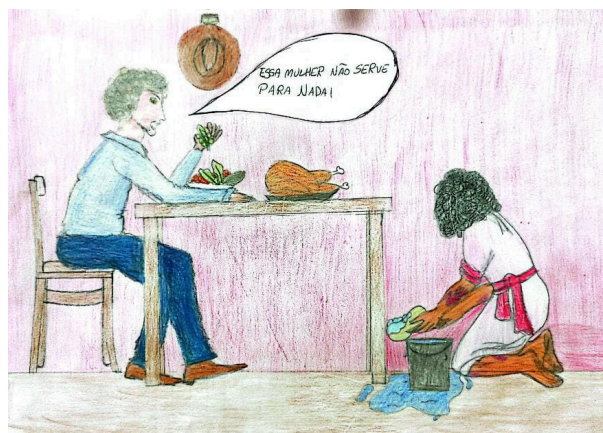
Figura 3: Charge 3 (C3)