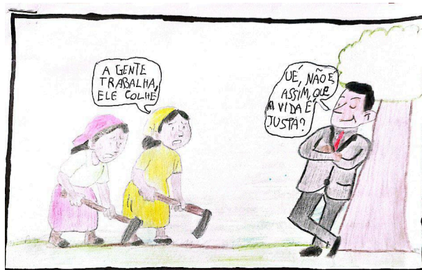
Figura 7: Charge 7 (C7)

As falas das personagens nas charges “A gente trabalha, ele colhe” e “Eu planto, mas quem colhe são eles”, dialogam diretamente com a exploração que atravessa toda a narrativa de Torto Arado (2019).