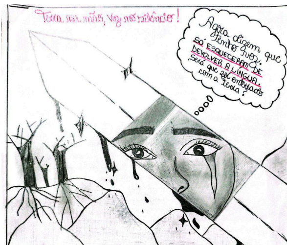
Figura 13: Charge 13 (C13)