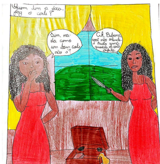
Figura 14: Charge 14 (C14)

A charge C14, intitulada “A luta e o silêncio”, e a charge C15 também representam o momento do acidente das irmãs com a faca. Na C15, os estudantes escreveram a frase “Sente o sangue e o vazio”, destacando a dor e a perda provocadas pelo acontecimento.