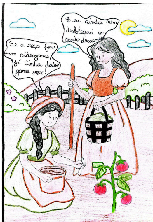
Figura 10: Charge 10 (C10)