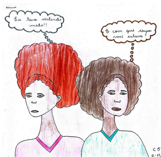
Figura 5: Charge 5 (C5)

Por fim, na charge C5 (Estudantes 11, 12 e 13, Turma B) (Figura 5), os alunos ilustraram o abuso sexual sofrido por Carmelita, filha de Donana. Na imagem, uma mulher questiona Carmelita sobre a roupa que ela usava no momento do abuso, ao que a personagem responde: “ Eu estava vestindo medo ”. Na escrita dos alunos, foi possível perceber uma crítica à forma como a sociedade costuma agir diante de casos de violência sexual. Em vez de culpar o agressor, muitas vezes as pessoas acabam responsabilizando a vítima, questionando, por exemplo, a roupa que ela usava. Essa charge mostra que os estudantes compreenderam a seriedade do tema e reconheceram a importância de falar sobre isso.