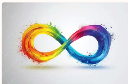
Imagem: Símbolo do Infinito nas cores do arco-íris que se misturam sem delimitação definida representando a amplitude do espectro autista.

As exigências sociais se tornam mais complexas na adolescência, e a consciência das diferenças em relação aos pares pode se intensificar, potencialmente levando a sentimentos de isolamento e baixa autoestima. Por outro lado, muitos adolescentes com TEA desenvolvem interesses específicos que podem se tornar pontos de conexão com colegas e oportunidades para o desenvolvimento de habilidades especializadas.