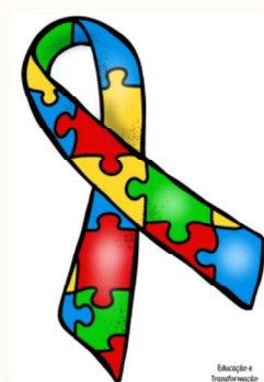
Imagem: Fita símbolo do Autismo, em forma de laço com desenho de peças de quebra cabeça colorido.