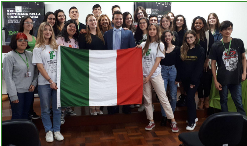
Foto 7: Intercambistas brasileiros com o cônsul da Itália Valerio Caruso.

Outro ponto de cunho diplomático relevante é o estabelecimento da coirmandade entre as duas cidades envolvidas Canoas e Pomezia, ambas situadas na região metropolitana de capitais: Porto Alegre e Roma, respectivamente, além de as duas possuírem bases aéreas e sediarem escolas técnicas de renome. Ao estabelecermos esse vínculo vitalício inúmeros benefícios à comunidade intra e extraescolar do IFRS – Campus Canoas são vislumbrados em prol do tripé almejado por nossa instituição Pesquisa, Ensino e Extensão.