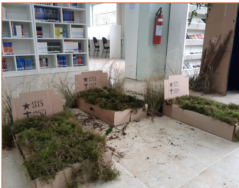
Imagem 3: Cenário do conto Venha Ver o Pôr do Sol , de Lygia Fagundes Telles, montado na biblioteca do Campus.

A Cartomante , de Machado de Assis, ficou com um dos grupos mais indisciplinados do Campus . Quatro gurus do segundo ano incorporaram a cartomante, a mulher, o amante e o marido, em uma das melhores atuações, escolhida para apresentar na Feira do Livro de Veranópolis. Por outro lado, um estudante com dificuldades de interpretação, escrita e até de comunicação oral, interpretou com êxito o homem picado por uma cobra, do conto À Deriva , de Horácio Quiroga. Foi eleito o ator revelação do projeto, pois surpreendeu a todos com sua desenvoltura e a encarnação íntegra do personagem.