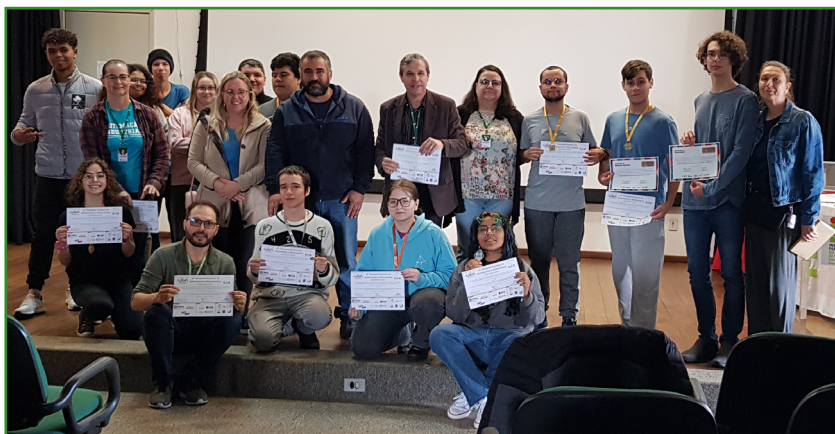
Figura 5 – Cerimônia de premiação 2023.

Na Figura 5, apresenta-se o momento de premiação para os alunos do Campus Rio Grande. Nem todos puderam comparecer, mas registra-se a presença de familiares que foram prestigiar o momento de integração e reconhecimento do mérito dos estudantes e de professores envolvidos no projeto.