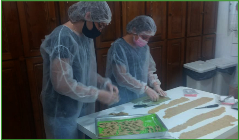
Figura 1. Registro da atividade prática realizada na escola do município de Erebangó/RS.

da Escola Estadual de Ensino Médio Irany Jaime Farina (EEM Irany Jaime Farina/Erechim/RS) e da Escola Estadual Irineu Evangelista de Souza (EE Irineu Evangelista de Souza/Erebango/RS), seguindo os protocolos de prevenção e controle ao COVID-19 e de alimentos seguros (Figura 1 e 2).