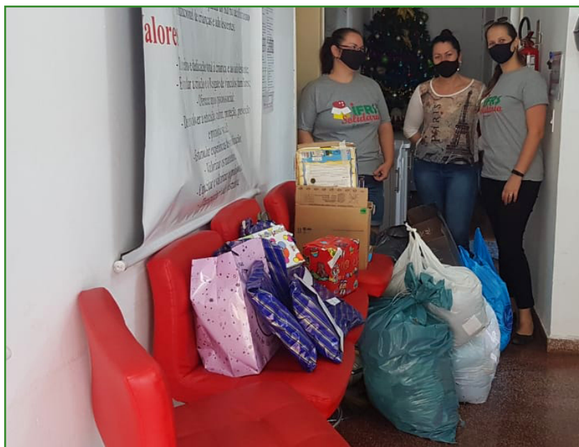
Foto 03 – Entrega de doações das Crianças em 2020.

A Campanha para arrecadação de tampinhas é realizada desde 2018, mantendo ponto de coleta permanente no Campus . As tampinhas são separadas por cor pelos voluntários e entregues para a ACAPASS e CEBRAS. Em 2020, iniciou-se a arrecadação de livros de todos os gêneros para doação ao projeto “Gelotecas”, que transforma geladeiras em bibliotecas espalhadas pela região metropolitana de Porto Alegre.