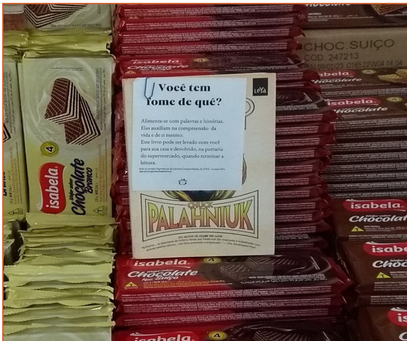
Foto 2: Livros dispostos em prateleiras do supermercado na ação “Você tem fome de quê?”.

que dispôs - em meio a frutas, verduras, grãos, bebidas e pães - aproximadamente 50 livros em prateleiras, esperando serem levados pelos leitores, conforme imagem abaixo. Cada livro possuía um bilhete explicativo sobre o projeto e sobre a devolução dos volumes, assim que terminasse a leitura. Em menos de dez horas, 85% dos livros foram levados pelos consumidores do supermercado, o que mostra o sucesso da proposição.