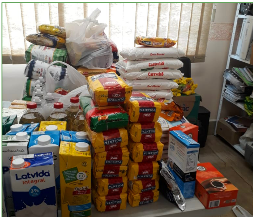
Foto 05 – Parte dos alimentos arrecadados em 2021/2.

instituição parceira do IFRS Solidário, abrindo caminho para a curricularização da extensão. Em 2021/2, os estudantes executaram uma ação para arrecadação de alimentos e elaboraram projetos para outras demandas do CEBRAS. Já em 2022/1, a turma pode conhecer as instalações do CEBRAS e levantar as demandas de forma presencial. Foram elaborados e executados dois projetos: arrecadação de recursos para melhorias da infraestrutura via PIX (Campanha 2+2) e mudanças nas redes sociais visando ampliar o número de pessoas que conhecem o trabalho realizado pela entidade. Em 2022/2 o trabalho está apenas começando, mas já foi realizado o levantamento de demandas reais para elaborar os projetos.