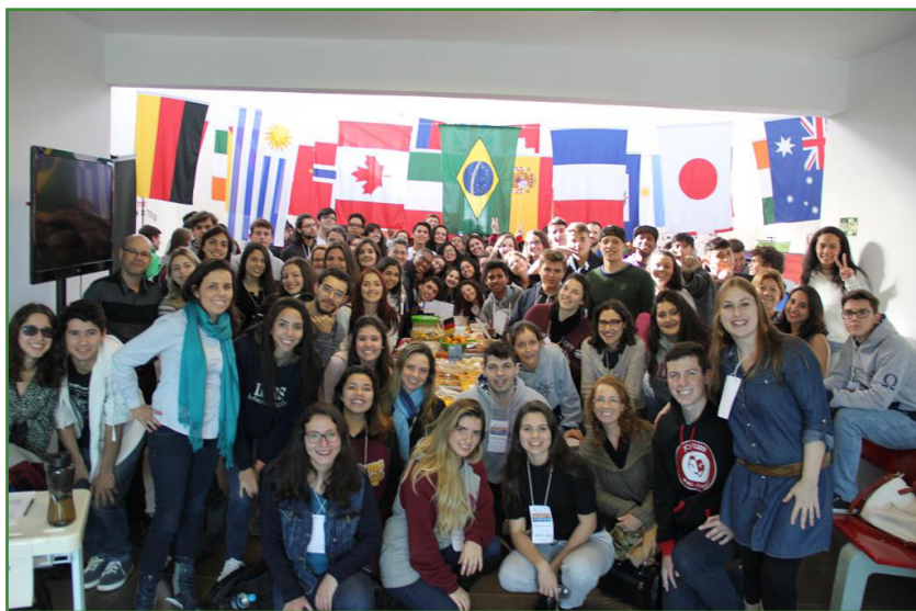
Foto 3: Tradicional “Coffee break internacional” na VII Feira das Cidades.

- Campus Canoas . Muitos alunos e ex-alunos voltaram ao evento que os motivou (segundo relato dos próprios alunos) para falar sobre suas viagens a trabalho e de lazer durante a Feira das Cidades. Diversas modalidades de participação são aceitas nessa ação extensionista que atrai, literalmente, o mundo para dentro de nossa instituição com participação de nativos haitianos, senegaleses e venezuelanos presentes na cidade de Canoas, além de mesas-redondas, sessões de cinema comentadas, relatos de viagem, oficinas de culinária, dança, artes marciais, etc., minicursos de língua estrangeira, exposições fotográficas ou de souvenirs trazidos de viagens, enfim, são três dias de intensas trocas culturais em que podemos “viajar sem sair do lugar”, aprendendo com cada fala um pouco mais de hábitos e culturas tão distantes através do olhar de viajantes que passaram pelos seis continentes.