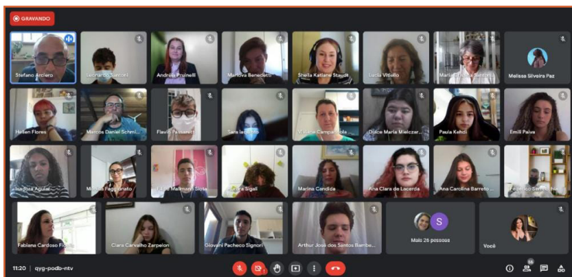
Foto 5: Encontros via Google Meet entre alunos brasileiros e italianos na Mobilidade Estudantil Virtual (2021-2022).