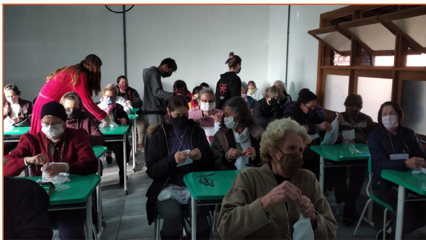
Foto 1: Estudantes auxiliando idosas em atividade de amarrar o pano que receberá a tinta.

Esse tempo, como define Jorge Larrosa (2003), é o tempo da experiência e, para que ela realmente aconteça, deve ser sem pressa, sem ânsias, sem expectativas, apenas é preciso que os envolvidos estejam dispostos a silenciar para, depois, compartilhar. Nesse sentido, atentos e dispostos a vivenciar as experiências compartilhadas a partir do encontro com os textos, com a arte e com o outro é que algo acontece no interior de cada um: idosos e adolescentes passam a olhar para suas vidas a partir de perspectivas diferentes, que não somente as suas. A poesia, a música e a pintura contribuíram para que cada idoso ao assumir, momentaneamente, o papel de aluno, produzisse seu objeto artístico - pintura em tecido - depois de olhar para suas vidas, para suas experiências.