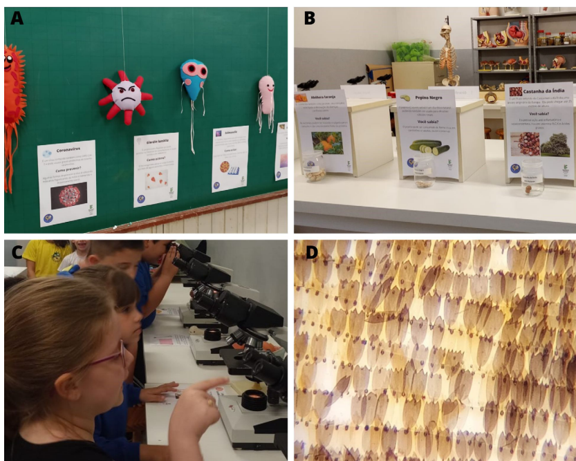
Figura 01: “Mostras de biologia” nas escolas parceiras do projeto. A) Representações lúdicas em feltro de bactérias, vírus e protozoários. B) Exposição de sementes nativas da região. C) Alunos observando diferentes lâminas histológicas em microscópio óptico. D) Escamas da asa de borboleta visualizada em microscópio óptico, aumento de 100 X.