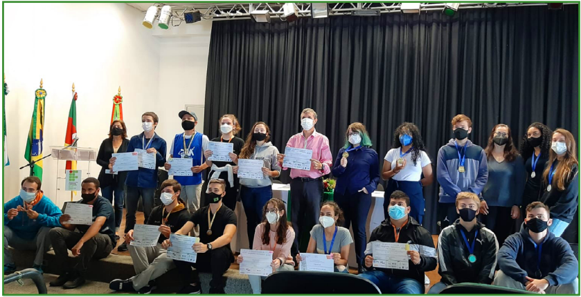
Figura 1 - Cerimônia de premiação 2022.