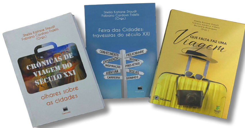
Foto 2: Publicações do programa “Olhares sobre as cidades”.

As três publicações advindas desse Programa possuem relatos em diversos idiomas 1 , conforme a língua escolhida pelo palestrante-viajante em sua apresentação e foram sempre divididas por capítulos-continentes: África - Ásia 2 – América - Antártida – Europa – Oceania 3 . A edição mais recente, de 2022, intitulada “Que falta faz uma viagem”, foi, pela primeira vez, impressa e em formato e-book, fato que propicia uma maior abrangência de leitores e um alcance extramuros de produtos bibliográficos produzidos por nossa Instituição. Até o momento foram coletados 70 relatos escritos por 78 autores.