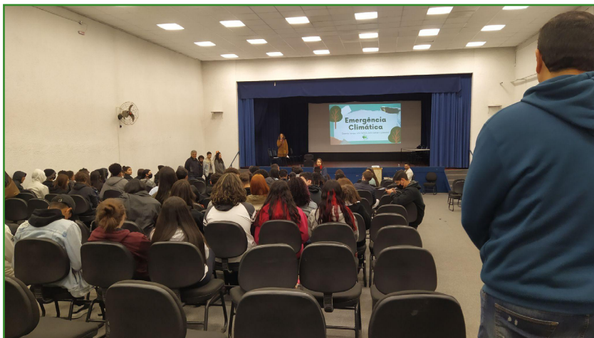
Figura 1 - Palestra sobre Emergência Climática na Escola Técnica Estadual Parobé.

participantes, entre alunos e professores, número que superou todas as expectativas do grupo (Figura 1). Por meio da avaliação dos participantes, 67,2% classificaram a palestra como boa e 31% como regular, atribuindo uma nota média de 7,9 à atividade. Através dos comentários feitos na avaliação, foi possível constatar a importância desse diálogo com os estudantes do ensino médio.