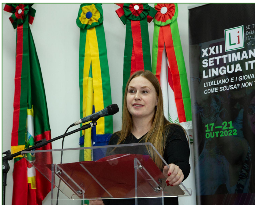
Foto 6: Encerramento da XXII Settimana della Lingua Italiana nel Mondo no IFRS - Campus Canoas.

gua Italiana, cujo tema era “O italiano e os jovens”, e prestigiar a apresentação, em vídeo, das duas escolas parceiras IIS Via Copernico de Pomezia e o IFRS - Campus Canoas, além de conhecer os intercambistas brasileiros. O momento foi de muita alegria à comunidade escolar, uma vez que esta foi a primeira vez que recebemos um cônsul em nossa Instituição e sediamos um evento internacional em nosso Campus .