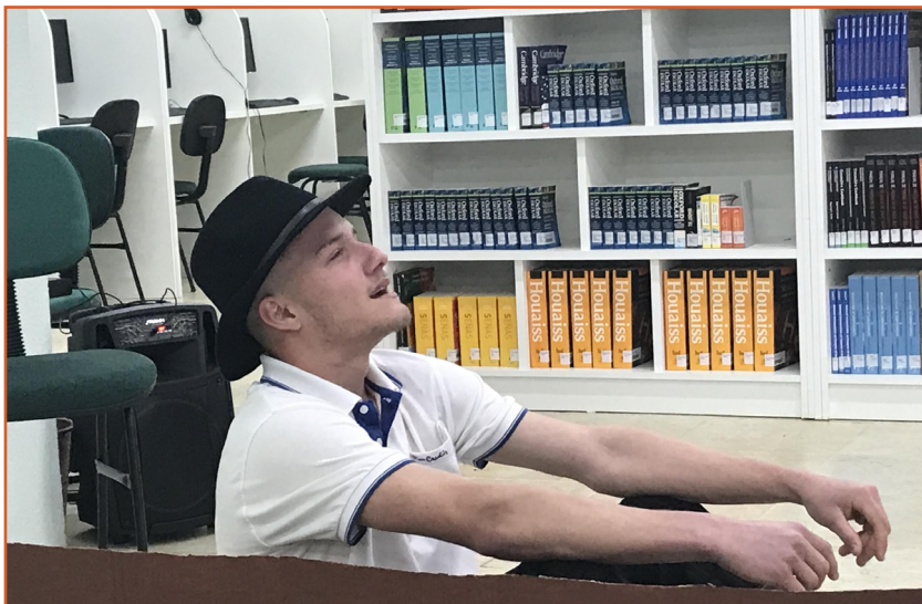
Imagem 4: Estudante encenando o homem picado por uma cobra, no conto À Deriva, de Horácio Quiroga, na biblioteca no Campus.

Grande desafio tiveram os integrantes do conto A Intrusa , de Jorge Luis Borges. Apresentaram em espanhol para manter a originalidade, e usaram partes de uma produção do cinema, deste clássico da literatura universal. Igualmente, sentiram-se desafiados os estudantes do conto Negro Bonifácio , de João Simões Lopes Neto, e optaram por apresentar com a música cantada pelo saudoso Cesar Passarinho. Para o conto E os Cisnes? , de Júlia Lopes de Almeida, o grupo montou um sanatório “de alienados” na biblioteca e deixou o público que assistia sem revelar o final do conto. Outro grupo que teve trabalho elaborando um grande espelho, todo decorado para a encenação, foi o do O Espelho , de Machado de Assis.