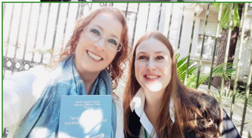
Foto 1 – Visitas aos consulados dos Estados Unidos e da Argentina.