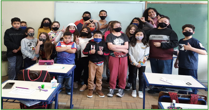
Figura 2 – Oficina com o 4º ano da E. E. E. F. Agnella do Nascimento.

A avaliação quantitativa do projeto se dá através do número de alunos atendidos, da efetiva participação e do desempenho destes nas competições. Já a avaliação qualitativa, ocorre de forma processual e dialógica. Na Figura 3, tem-se uma demonstração da participação massiva dos alunos na OBMEP Mirim, na Escola Estadual de Ensino Fundamental. Barão de Cerro Largo.