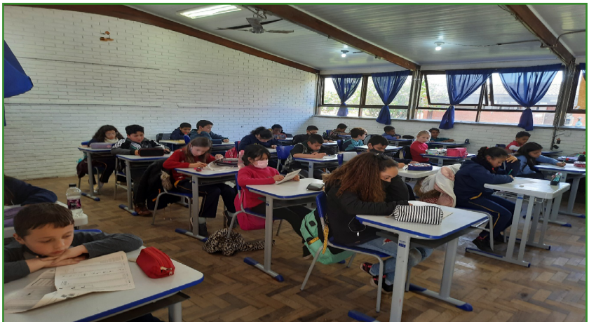
Figura 3 – Aplicação da prova da OBMEP Mirim .

A avaliação quantitativa do projeto se dá através do número de alunos atendidos, da efetiva participação e do desempenho destes nas competições. Já a avaliação qualitativa, ocorre de forma processual e dialógica. Na Figura 3, tem-se uma demonstração da participação massiva dos alunos na OBMEP Mirim, na Escola Estadual de Ensino Fundamental. Barão de Cerro Largo.