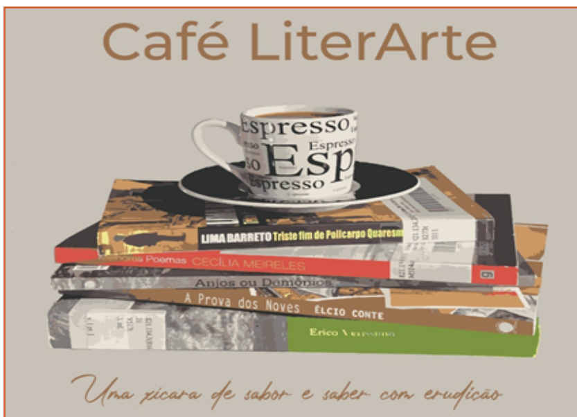
Imagem 1: Logotipo do projeto.

Para incentivar o gosto e hábito pela leitura de textos literários, adotou-se o método criativo que emprega práticas de caráter artístico, pautado em três fatores: o sujeito criador, o processo de criação e contexto cultural e histórico (BORDINI, AGUIAR, 1988). Todos os estudantes do segundo e terceiro anos do curso Técnico Integrado em Administração do Campus Veranópolis foram convidados a participar do projeto. A proposta foi pensada para alunos que já se sentiam mais à vontade no Campus . Conhecendo um pouco da personalidade de cada um dos participantes, grupos foram selecionados e, de acordo com as afinidades e gostos, foram distribuídos os contos escolhidos pela equipe do projeto. Os contos, em língua portuguesa e espanhola, visam autores e textos que, frequentemente, são apontados nos processos seletivos de vestibulares e ENEM.