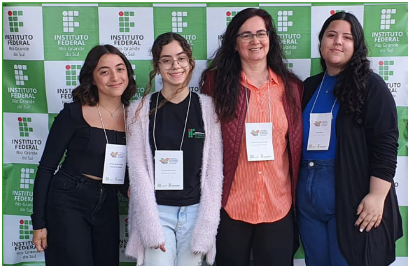
Figura 4 – Participação no 7º Salão de Pesquisa, Extensão e Ensino do IFRS.

características essenciais para a formação almejada. Além de terem a oportunidade de participarem de eventos científicos e de divulgação do trabalho desenvolvido, como no 7º Salão de Pesquisa, Extensão e Ensino do IFRS, em registro na Figura 4.