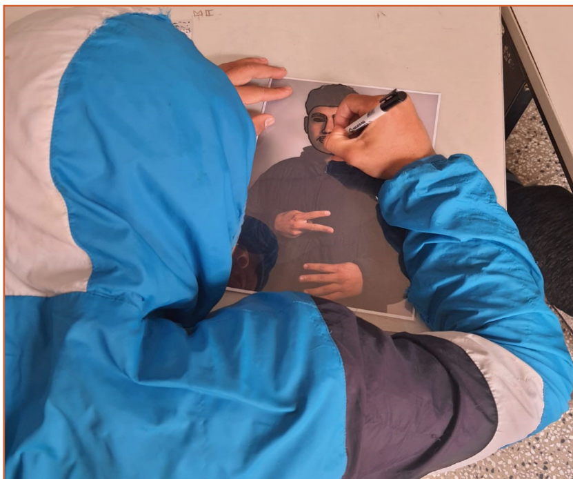
Foto 3: Adolescentes em privação de liberdade em ação com a temática "identidade".

no Case de Caxias do Sul/RS, parceiro do IFRS - Campus Feliz , desde 2018. Assim, a temática Identidade foi escolhida pelas equipes organizadoras dos projetos e o grupo técnico da socioeducação do Case e, em alguns encontros de planejamento, organizamos duas oficinas para duas turmas de adolescentes internos, vinculados à Escola Paulo Freire, que funciona dentro da instituição. A leitura de conto e poesias, o encontro consigo mesmos através do espelho e, posteriormente, com a arte da fotografia foram os fios condutores que os levaram a redimensionar o olhar para seus rostos e corpos e, conseqüentemente, para pensarem sobre quem são, para além da imagem, conforme imagem abaixo. Ver-se no espelho e na arte fotográfica e pensar sobre si a partir do que os textos possibilitaram é abrir-se à experiência; é, portanto, revisitar-se através da arte e, assim, projetar-se para além dos muros.