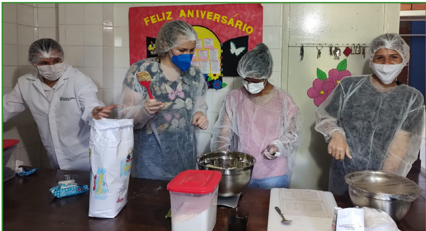
Figura 2. Registro da atividade prática na escola do município de Erechim/RS.