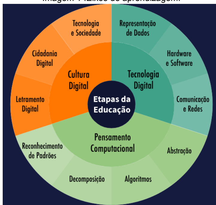
Imagem 1 :Eixos de aprendizagem.