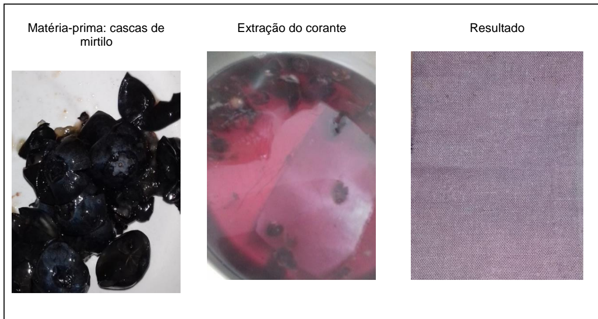
Figura 2- Experimento (a)