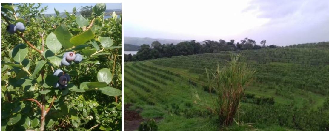
Figura 1- Plantação de Mirtilos

O mirtilo (figura 1) é uma fruta do gênero Vaccinium . Uma planta nativa da América do Norte, desde o Sul dos Estados Unidos até o Leste do Canadá da família botânica, Ericaceae . Foi introduzido no Brasil pela Embrapa na década de 1980, na região Sul, onde os invernos rigorosos proporcionaram boa adaptação da planta, principalmente nas regiões de maior altitude. Nos EUA e na maior parte do mundo é conhecido como Blueberry , e na Argentina como Arándano (EMPÓRIO DO MIRTILO, 2019).