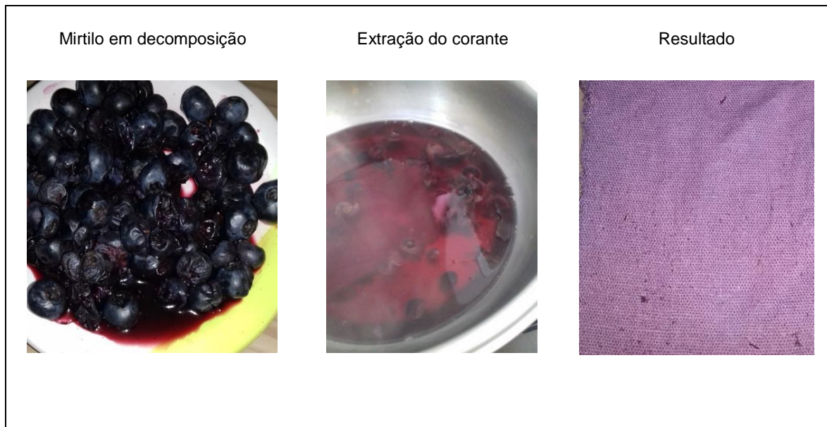
Figura 3- Experimento (b)