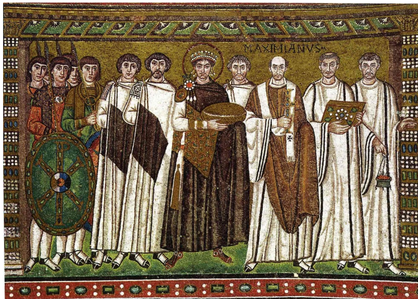
Figura 3- Imperador Justiniano e sua corte