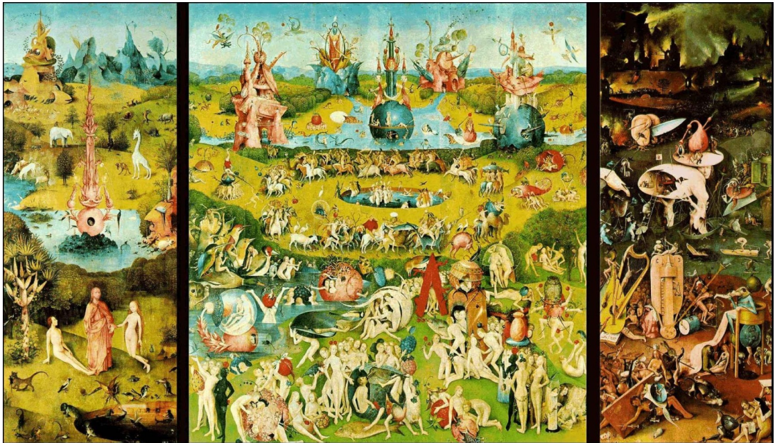
Figura 1- O Jardim das Delícias Terrenas

Fonte: Bosch, 1515. Acesso em: https://www.wikiart.org/pt/hieronymus-bosch/o-jardim-das-delicias-terrenas-1515