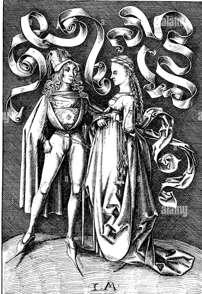
Figura 5- Gravura de Israel van Meckenem em 1470