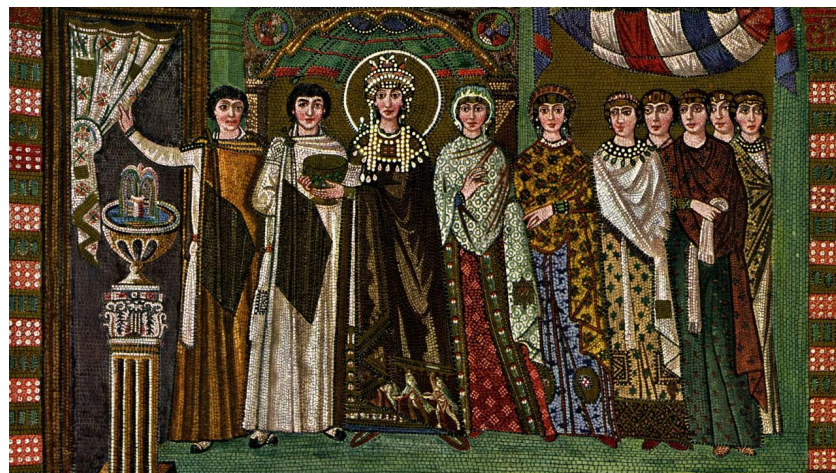
Figura 4- Imperatriz Teodora e seu séquito