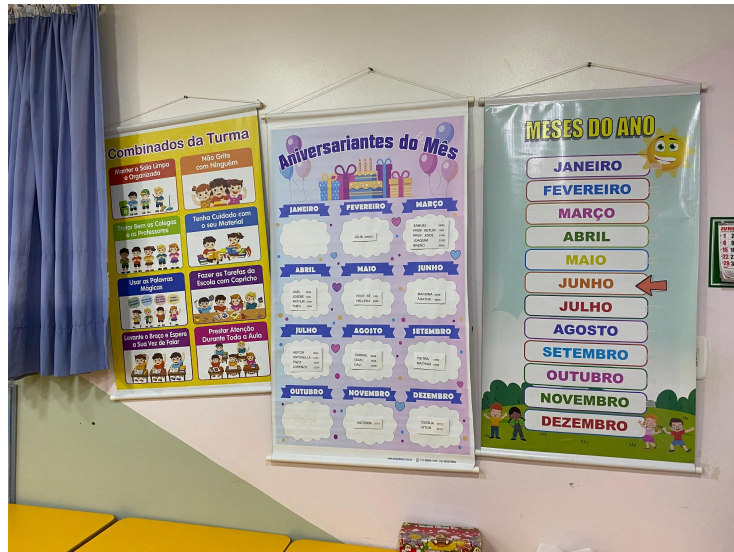
Apêndice D - Registro fotográfico do brincar das crianças de 2 e 3 anos na sala de referência